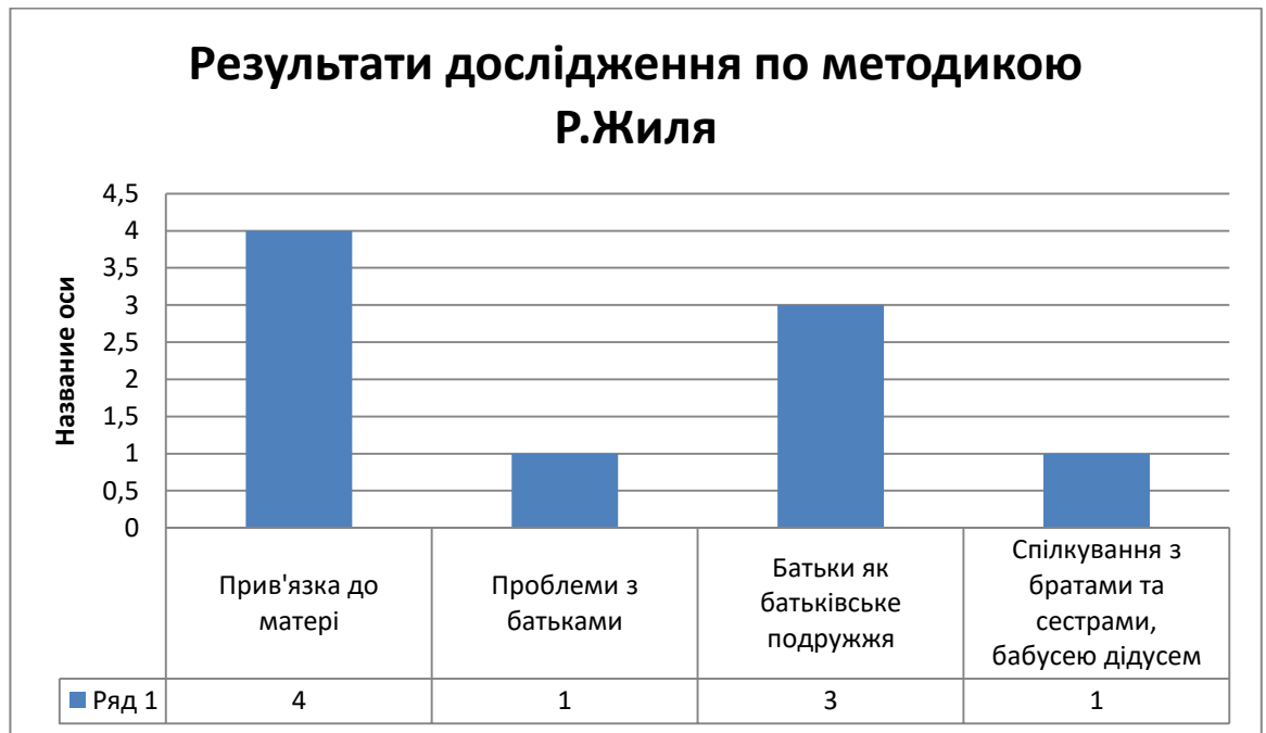
Рис. 2.1. Результати дослідження дітей дошкільного віку по методикою Р.Жиля

За методикою Р. Жилия у сфері дитячо-батьківських відносин ми отримали такі результати, що більшість дітей дошкільного віку прив'язані до матері, 70 % дітей дошкільного віку сприймають батьків, як батьківське подружжя, у 30 % дітей мають віддають перевагу спілкуванню з братами та сестрами, а також зі старшим поколінням (бабусі, дідусі).