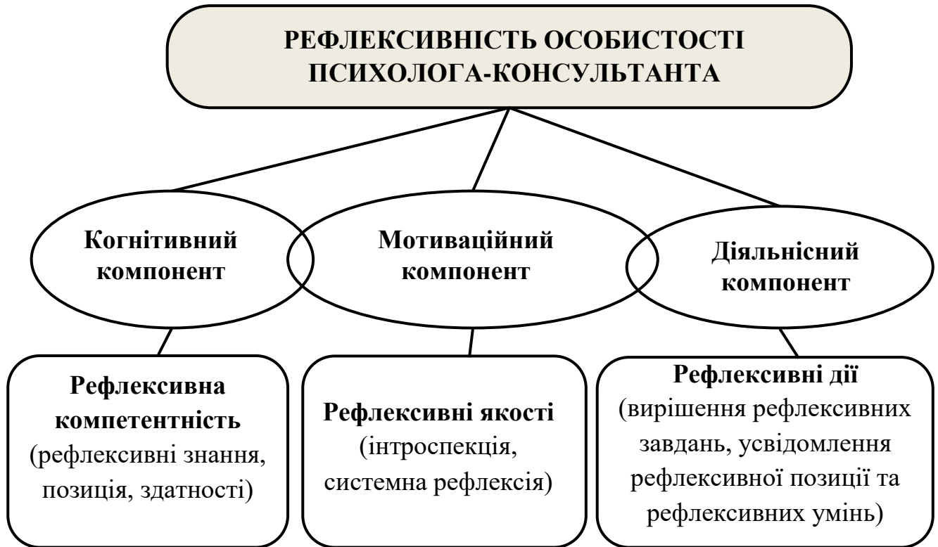
Рис. 2.1. Структурна модель рефлексивності особистості психолога-консультанта