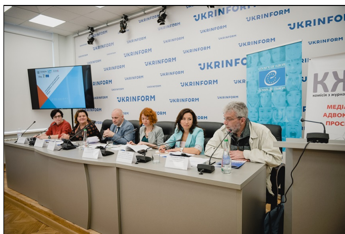
Рис. 2.1.1. Засідання Комісії з журналістської етики

Комісія з журналістської етики діє як всеукраїнська громадська організація, що створена 16 вересня 2001 року під час установчих зборів журналістської ініціативи «Журналісти – за чисті вибори», а громадська організація була зареєстрована Міністерством юстиції України у 2003 році.