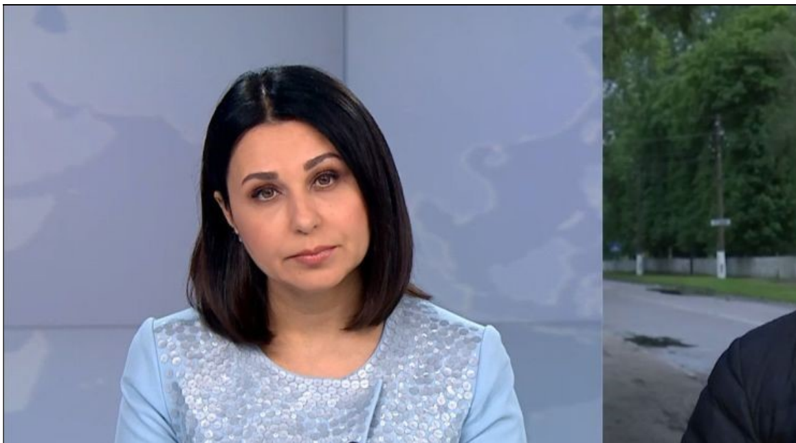
Рис. 2.2.1. Сюжет на телеканалі 1+1

Об'єктом скарги є сюжет ТСН «Як відчувається зґвалтована поліцейськими дівчина: докладніше про жертву кагарлицьких копів» від 26 травня 2020 року про потерпілу у зґвалтуванні з боку поліцейських. Суттю матеріалу є висвітлення детальної інформації про потерпілу, включаючи її місце проживання, особисті дані потерпілої та сімейний стан. Разом з цим матеріал містить інформацію про захворювання дитини потерпілої.