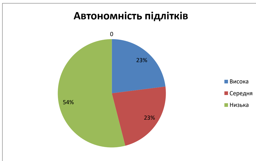
Рис. 2.5. Автономність підлітків