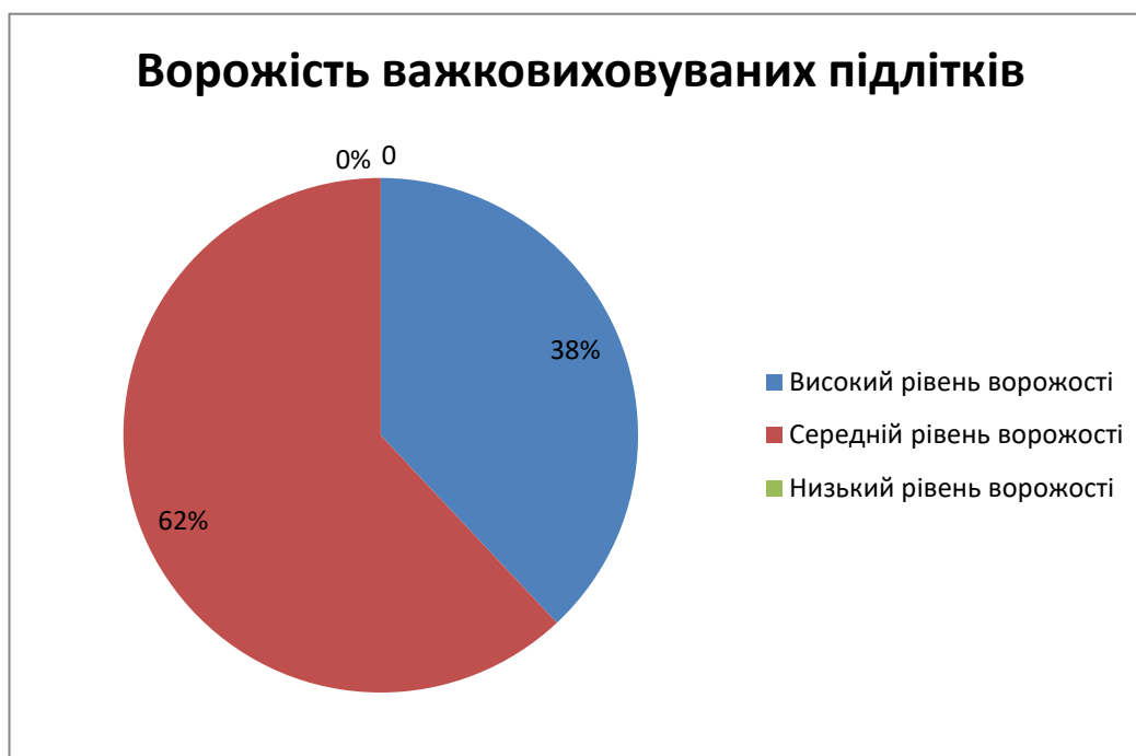
Рис. 2.3. Рівень ворожості за опитувальником Басса-Даркі у підлітків

За методикою вивчення соціалізованості особистості учня – виявлення ступеня суспільної адаптованості, ініціативності, автономності, моральності (М.І. Рожкова), ми отримали такі результати (рис. 2.4., 2.5., 2.6., 2.7.).