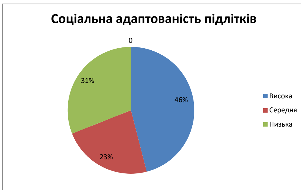
Рис. 2.4. Соціальна адаптованість підлітків