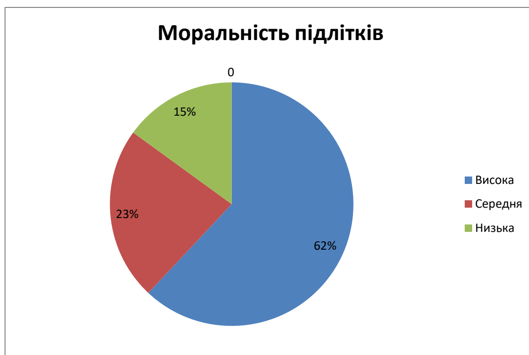
Рис. 2.7. Моральність підлітків