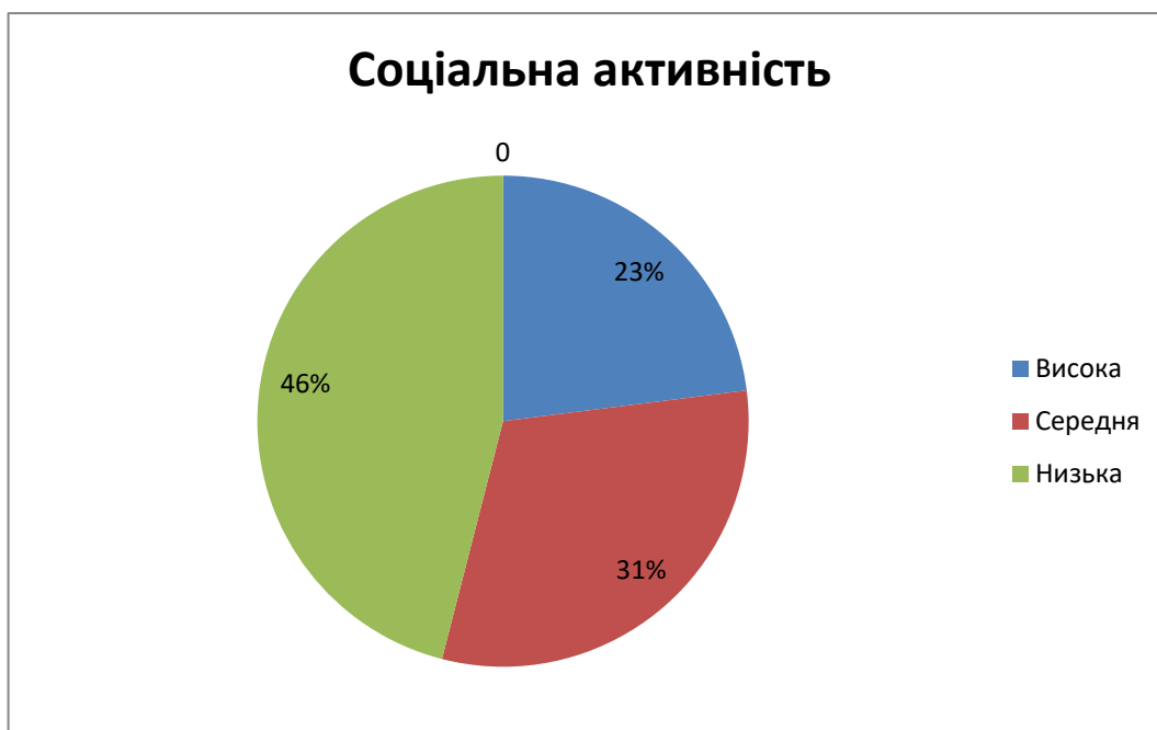
Рис. 2.6. Соціальна активність підлітків