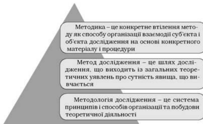
Рисунок 1.1 – Взаємозв'язок методології, методів і методик наукового дослідження

Наукове дослідження ґрунтується на методологічних засадах, здійснюється на основі використання відповідних методів і методик. (рис. 1.1)