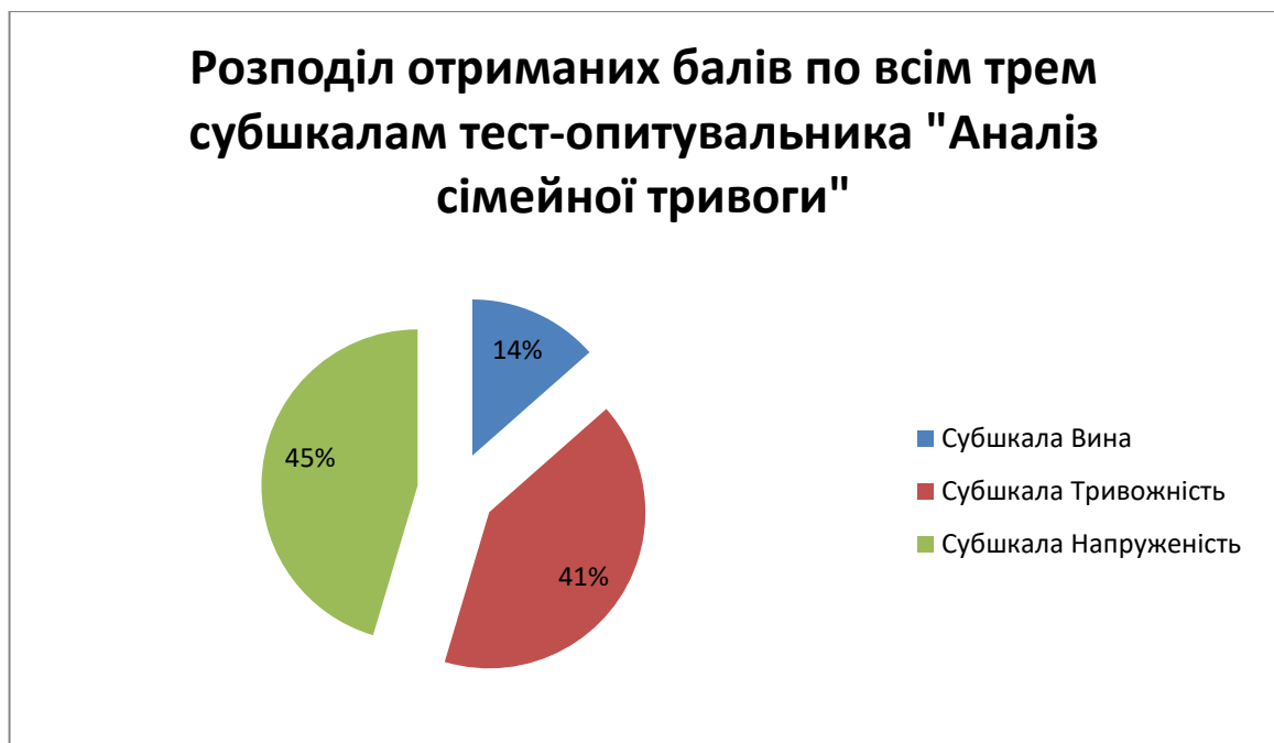
Рис. 3.1 Розподіл отриманих балів по всім трьом шкалам тест-опитувальника «Аналіз сімейної тривоги».

Якщо підрахувати всі бали за кожною субшкалою тест-опитувальника «Аналіз сімейної тривоги» (АСТ), ми можемо побачити, яка саме субшкала більш виражена в українських сім'ях нашої вибірки.