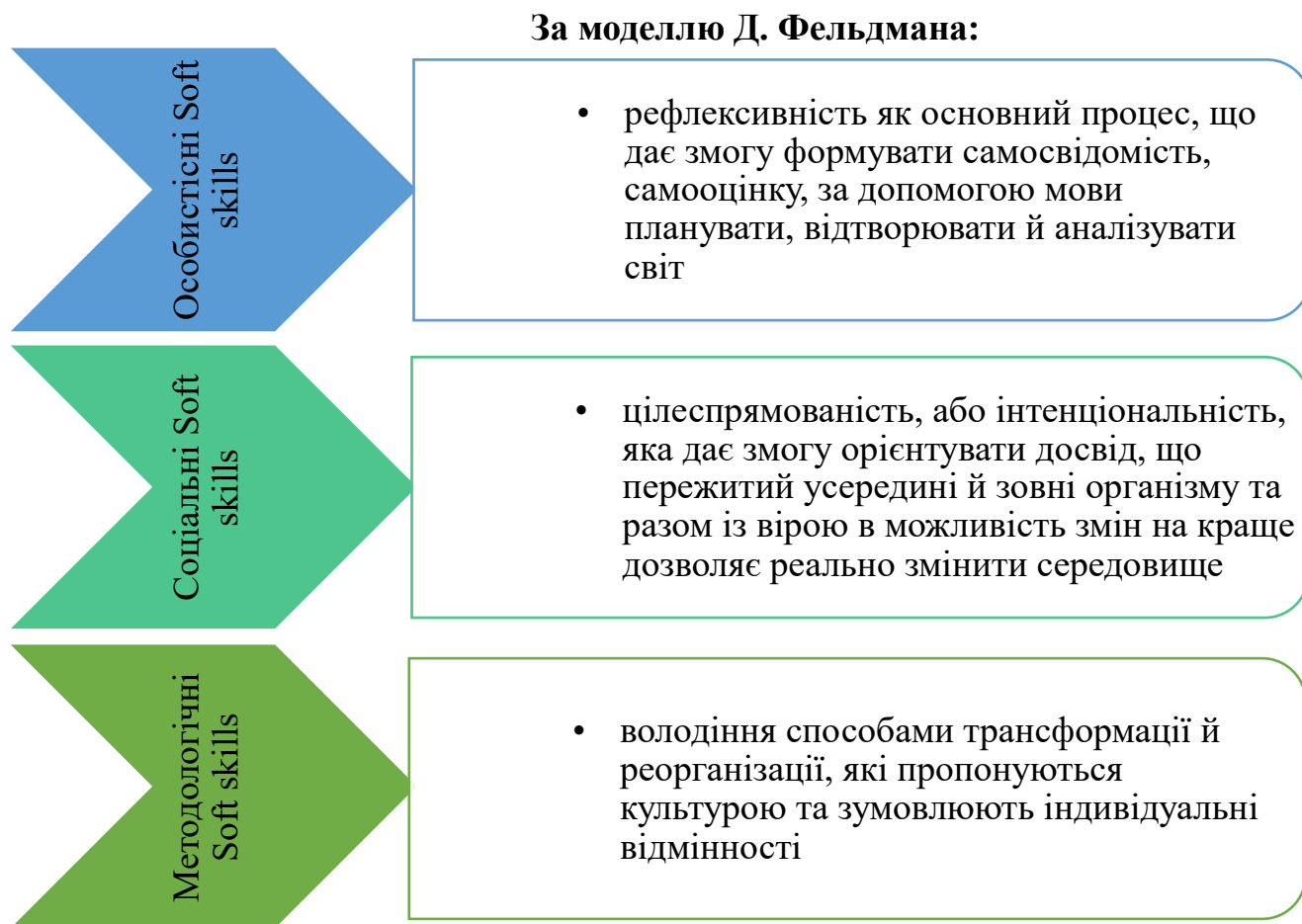
Рис. 1.1. Модель дослідження

Модель креативного процесу розробленою Д. Фельдманом містить три пов'язані між собою складові, які, на нашу думку, мають детермінуючий вплив на три групи в класифікації Soft skills (рис. 1.1).