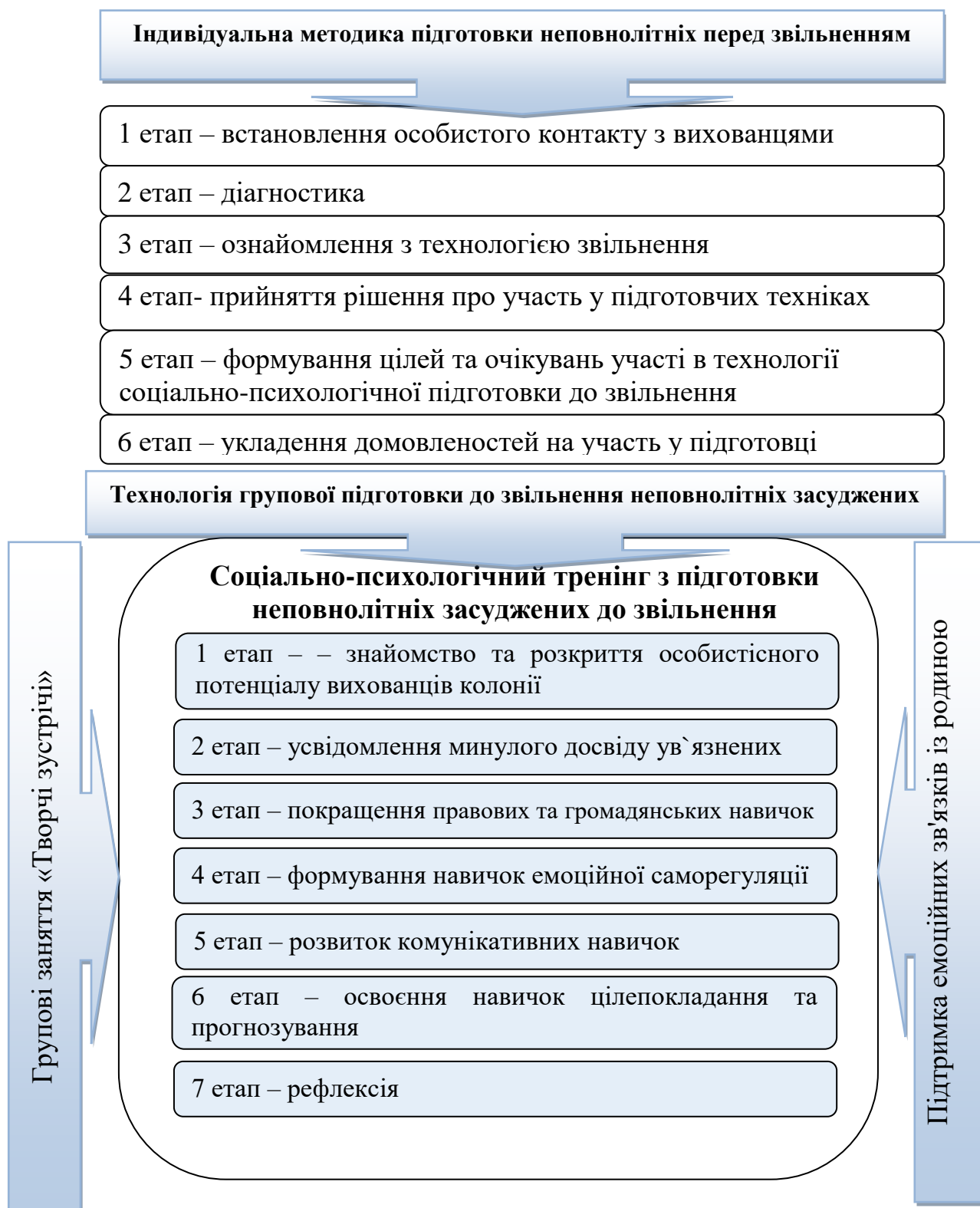
Рис. 2.3. Схема впровадження технології соціально-психологічної підготовки до звільнення неповнолітніх вихованців