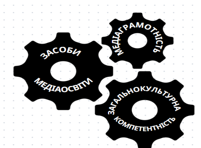
Рисунок 1.2. Взаємозалежність компонентів

Отже, формування загальнокультурної компетентності вчителів початкових класів можливо різноманітними способами: проходження вчителями курсів, семінарів чи тренінгів, присвячених аспектам загальнокультурної компетентності, поєднання навчання з відвідуванням культурних заходів, виставок, концертів для більш глибокого розуміння різних аспектів культури, використання вчителями онлайн-ресурсів, книг, статей, що розширюють їхні знання про культури світу та різноманітними засобами медіаосвіти.