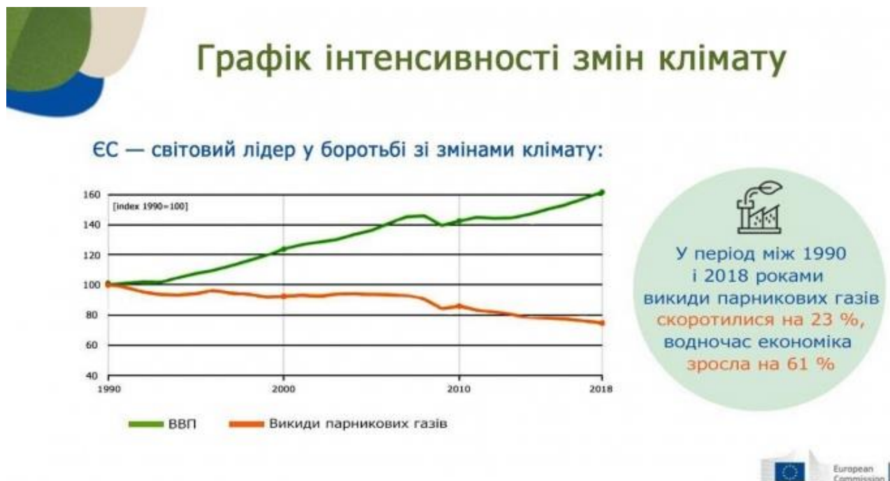
Рисунок 1.1 – Інтенсивність змін клімату та динаміка викидів парникових газів

З 1990 року по 2018 рік промисловість ЄС скоротила викиди парникових газів на 23%, а економіка зросла на 61%.