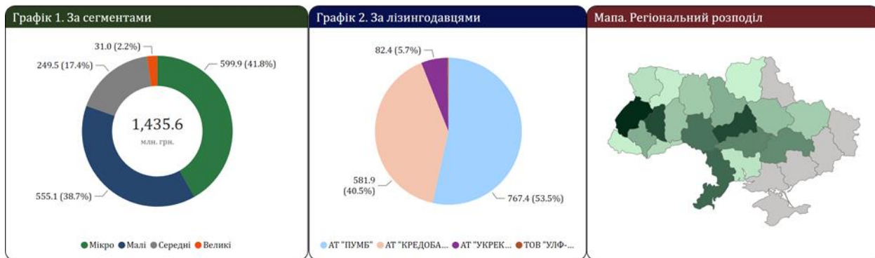
Рисунок 2.1 – Інформація про результати Державної програми «Доступний фінансовий лізинг 5 – 7 – 9» станом на 01.11.2023 р.

У липні 2022 р. Уряд розпочав реалізацію грантової програми для переробних підприємств «Новий рівень», якою передбачено надання підприємцям грантів сумою до 8 млн грн на розвиток переробного бізнесу за умови створення щонайменше 25 робочих місць [33]. Грант покриває 70 % загальних витрат на проєкт для перших 1000 отримувачів і 50 % – для решти. Кошти можна витратити на придбання, доправлення та введення в експлуатацію виробничого обладнання. У 2022 р. гранти на розвиток переробних підприємств отримали 178 підприємців на майже 1 млрд грн, на квітень 2023 р. – 61 переробне підприємство на суму 282 млн грн [34].