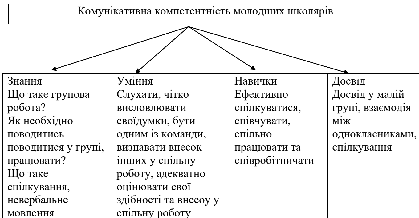
Рисунок 1.2. Структура комунікативної компетентності молодших школярів

Результативність діалогу здійснюється при досягненні мети усіма учасниками спілкування, коли висловлюється та вислуховується кожен, без особистих образ.