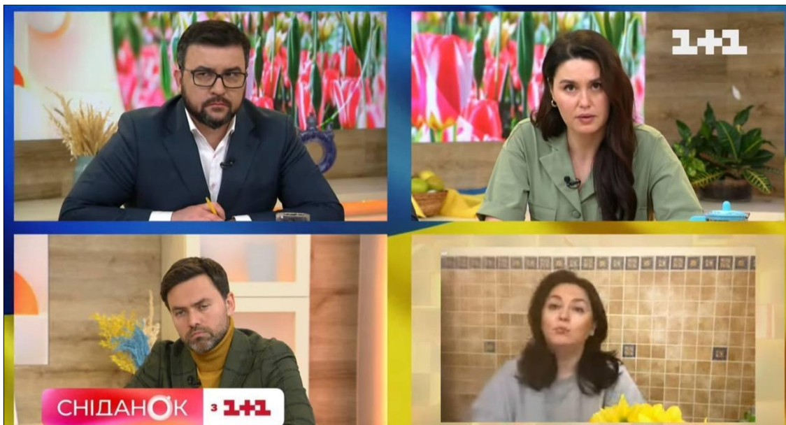
Рис. 2.2.2.5 Пряме включення з рубрики «Консультації психолога» за 04.04.2022 р.

не спостерігалось різноманіття рубрик, більш типовою була вільна структура та велика кількість обговорень.