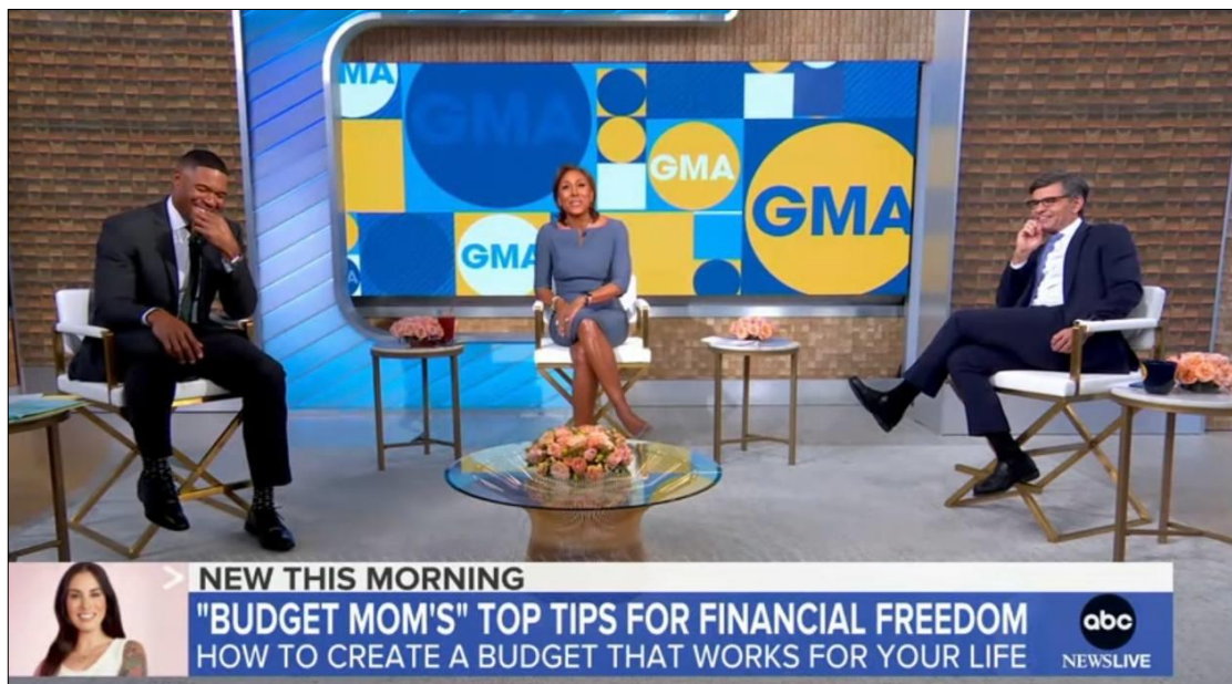
Рис.2.1.1 Ведучі «Доброго ранку, Америка». Початок випуску за 02.02.2022 р.

Отже, о 7:00 в етері «Доброго ранку, Америка» з'явилися Робін Робертс, Джордж Стефанопулос та Майкл Страхан. Так звана «золота трійка» цієї ранкової телепрограми, яка залишається незмінною з 2016 р. На самому початку вони сидять у студії на трьох стільцях, вітаються з глядачами, розповідають про плани на найближчі 2 години (рис.2.1.1).