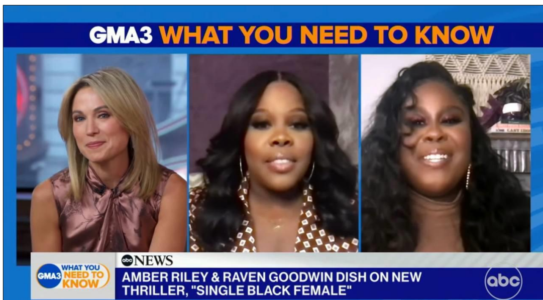
Рис.2.1.11 Ембер Райлі та Рейвен Гудвін одночасно приєднані до прямого Етеру 02.02.2022 р.

запрошення зірок кіноіндустрії. Тому 2 лютого 2022 р. не стало винятком, адже в межах «Все, що потрібно знати», ведучі поспілкувалися з молодими акторками Ембер Райлі та Рейвен Гудвін, які нещодавно знялися у новому фільмі «Самотня чорна жінка» ( http://surl.li/npdmg ). На початку було показано уривок з цього кінофільму. Після, молоді жінки приєдналися до ранкового шоу через відеозв'язок (рис.2.1.11). Вони відповіли на питання ведучих про те, чим їх привабили ролі, про саму кінороботу та майбутні плани. Традиційно інтерв'ю супроводжувалося фото та відео з професійної діяльності Ембер Райлі та Рейвен Гудвін.