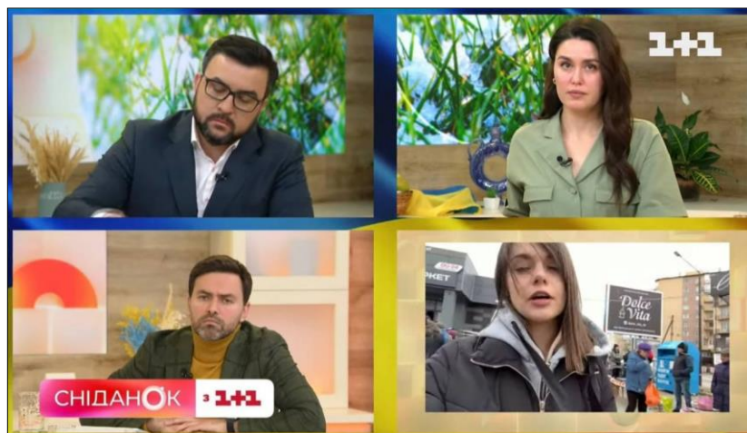
Рис. 2.2.2.2 Пряме включення з окупованої Нової Каховки за 04.04.2022 р.