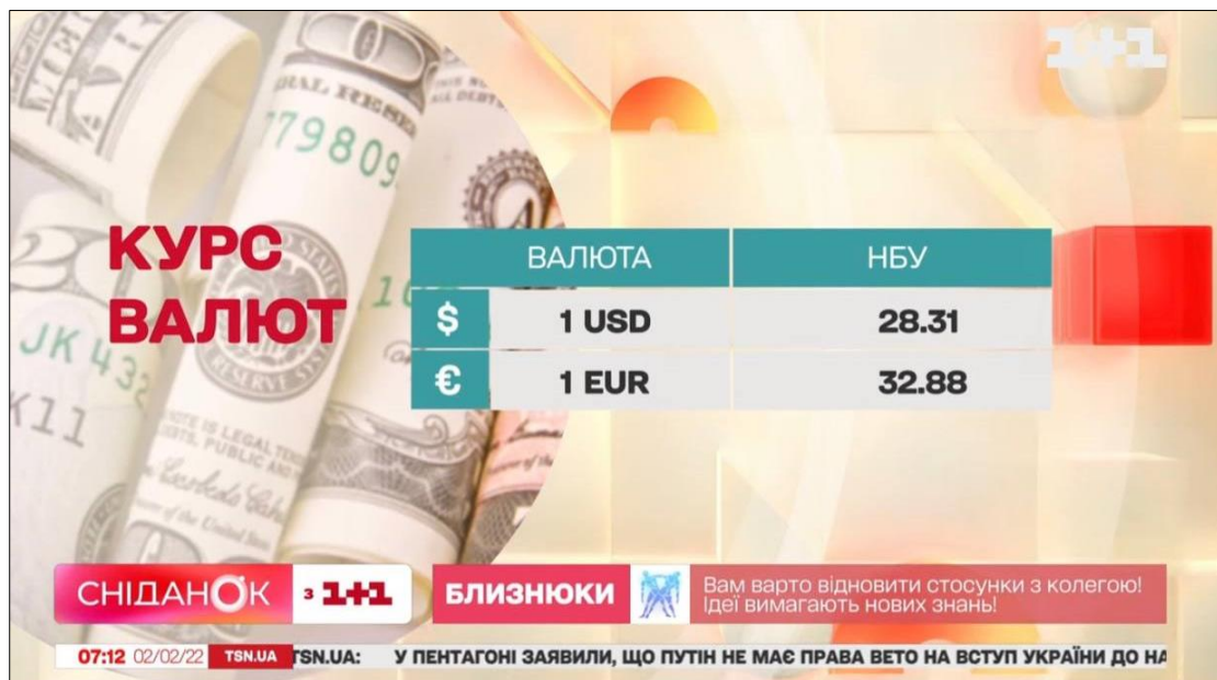
Рис. 2.2.1.4 Анімована графіка «Курс валют» за 02.02.2022 р.

Також в ранковому шоу є постійна рубрика «Економічні новини». Кожного дня оголошується актуальний курс валют у вигляді анімованої графіки (рис. 2.2.1.4).