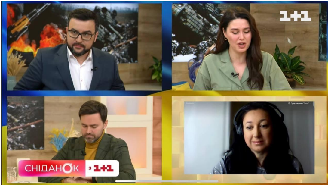
Рис. 2.2.2.4 Пряме включення з рубрики «Щоденники війни» за 04.04.2022 р.