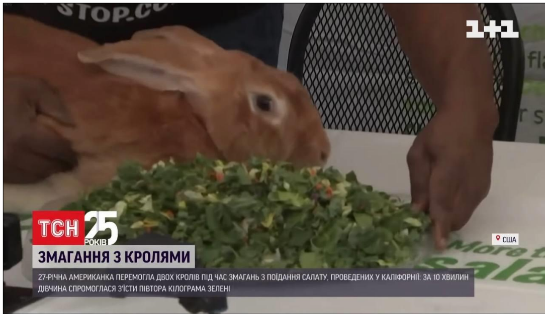
Рис.2.2.1.2. Зображення тварин в сюжеті «Змагання кролів в США».