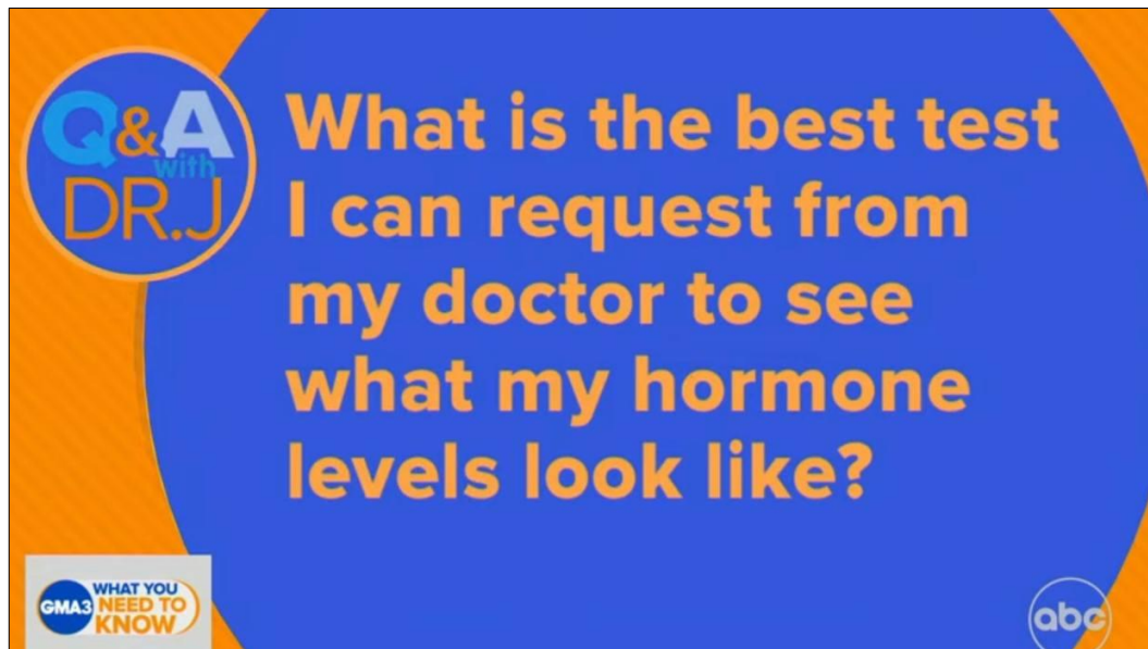
Рис.2.1.12 Питання глядачів у вигляді анімованої графіки за 02.02.2022 р.

Холмсом або Емі Робак зачитують питання, воно з'являється на екрані у вигляді анімованої графіки (рис.2.1.12).