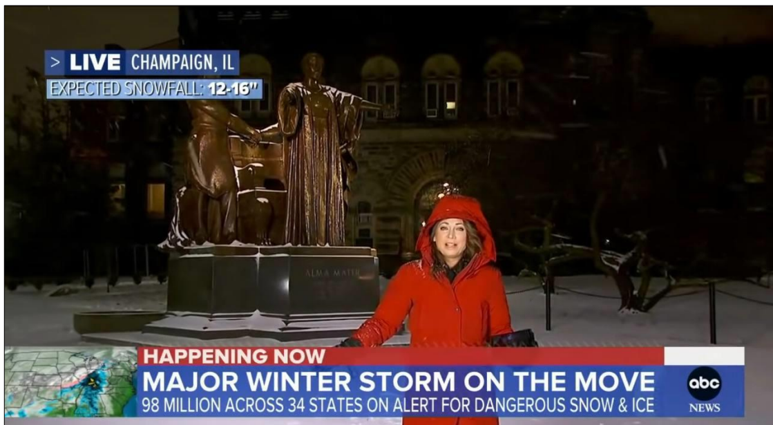
Рис.2.1.7 Обіграний стедап ведучої телепрогнозу погоди Джинджер Зі.

Рубрика погоди є однією з найстаріших на телебаченні. Тому її наявність у ранковому шоу «Доброго ранку, Америка» не є здивуванням. Погодну рубрику на каналі ABC з 2013 р. веде телевізійниця Джинджер Зі. 2 лютого 2022 р. вона вийшла в прямий етер з міста Шампейні штату Іллінойс (рис.2.1.7). Адже саме в цьому місці 90 мільйонів людей у Хартленді готуються до сильного зимового шторму. Включення ведучої почалося з обіграного стендапу.