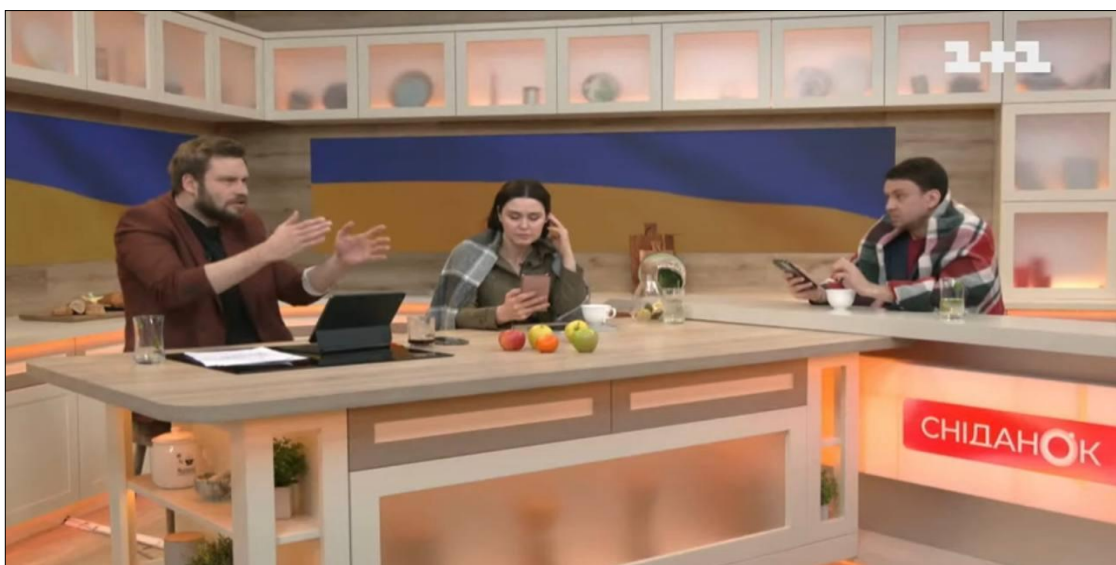
Рис.2.2.2.1 Повернення «Сніданок з 1+1». Випуск за 04.03.2022 р.

Вже 4 березня ранкове шоу «Сніданок з 1+1» повернулося, проте у новому інтернет-форматі (рис. 2.2.2.1). Було прийняте рішення поновити Сніданок в форматі Youtube-трансляції.