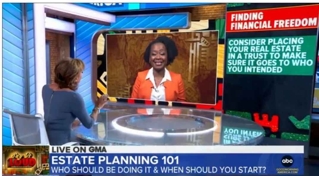
Рис. 2.1.4 Пряме включення з експерткою та задіяння додаткового екрану

у вигляді коментованого відеоряду, який супроводжувався, також, і коментарями людей, які використовують у житті елементи методик фінансового тренера. Згодом, до Робін Робертс у студію у форматі прямого включення приєдналася Лінн Річардсон. Вона є автором книги «Просте планування нерухомості». Робін задавала їй питання стосовно особливостей планування нерухомості, поради фінансової стабільності, та про те як побудувати стабільні грошові відносини в сім'ї. Інтерв'ю супроводжувалося візуальним зображенням основних тез експертки. Екран у студії був розділений на дві частини. На першій було візуальне зображення Лінн Річардсон, на другій частині текстовий перелік найважливіших положень (рис. 2.1.4).