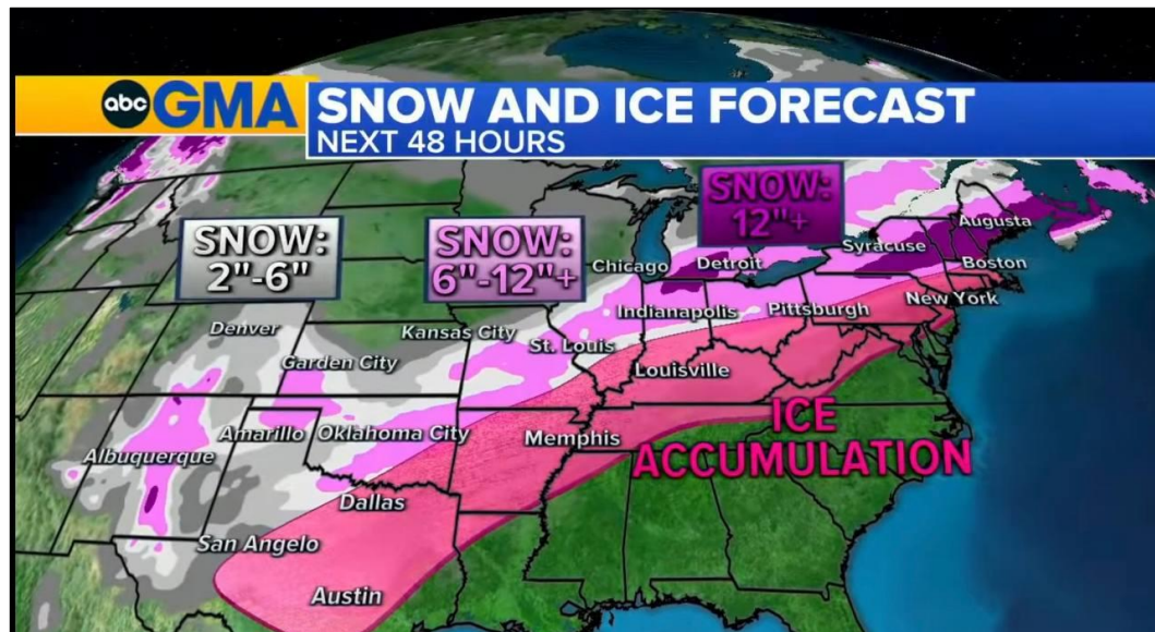
Рис.2.1.8 Анімована графіка прогнозу погоди за 02.02.2022 р.