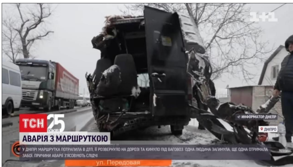
Рис. 2.2.1.1 Приклад зображення резонансного ДТП в Дніпрі.

2 лютого в «ТСН. Ранок» із 19 новин було 12 матеріалів стосувалося України, а 7 – світу. Новинний блок починався інформації про резонансне нічне ДТП у Дніпрі (рис. 2.2.1), одразу після йшли матеріали політичного характеру про зовнішню політику України. Опісля традиційно ведучий озвучив статистику захворюваності на коронавірус в країні. Загалом, новини мають дуже різноманітну тематику. Проте домінують повідомлення про стихійні лиха, ДТП та міжнародну політику.