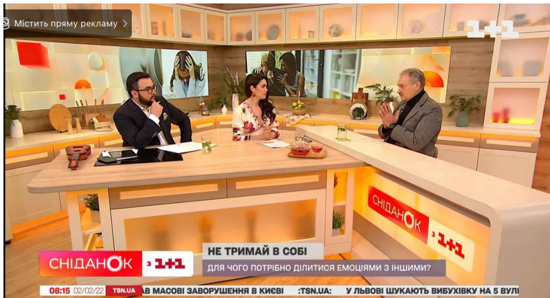
Рис.2.2.1.6 Психотерапевт Олег Чабан в студії «Сніданку з 1+1».

Традиційною рубрикою «Сніданок 1+1» вже стали «Рецепти Руслана Сенічка». На цьому тижні, коли був випуск 2 лютого, відбувалися своєрідні кулінарні батли з телепрограмою «Твій день». «Твій день» – це денне інфотеймент-шоу. Яке транслюється в ефірі «1+1» вдень протягом 5 хв. Починається після блоку з серіалами або повторами шоу об 11:25.