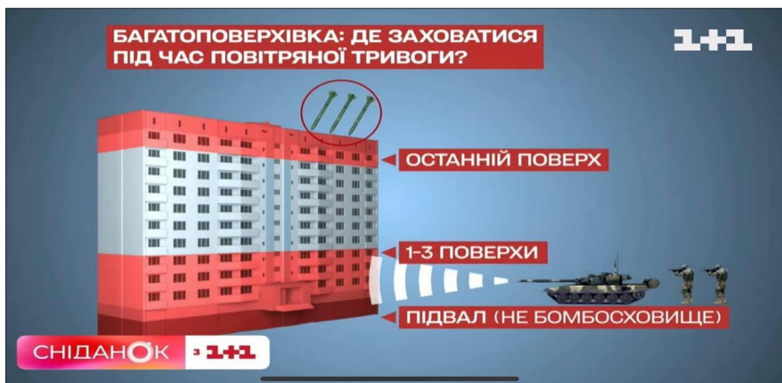
Рис. 2.2.2.7 Анімована графіка з відео-пам'ятки «Де ховатися під час повітряної тривоги?» за 04.04.2022 р.

Міжблоками ранкового шоу, редакторська група транслювала мотиваційні ролики «Як воно: бути українцем?», про міста героїв, та відео-нагадування про заборону фотографувати та знімати будівлі, місця прильотів та українську військову техніку. Постійно транслювалися відеопам'ятки «Де ховатися під час повітряної тривоги?» (рис.2.2.2.7). Завданням цих відео було не тільки проінформувати глядачів про важливе, а й підняти патріотичний настрій населення.