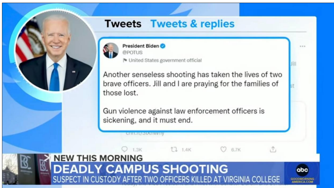
Рис. 2.1.6. Анімована графіка коментаря Джо Байдена.