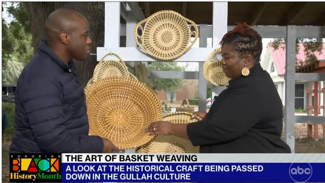
Рис.2.1.9 Репортаж Кеннета Мотона в Південній Кароліні.

До того ж, «Місяцю чорної історії» було приурочене пряме включення з начальником штабу Повітряних сил США, генералом К.К. Браун ( http://surl.li/npesh ). Генерал очолює підрозділ збройних сил США. Він став першим афроамериканцем на цій посаді. Ведучі поспілкувалися з військовим і запитали його особливості його посади. Не зважаючи на свій статус, К.К. Браун відповідав на питання досить інформативно та розлого. Під час його розповіді на екрані демонструвалися кадри зі служби. У кінці генерал висловив мотиваційну промову для всіх молодих людей.