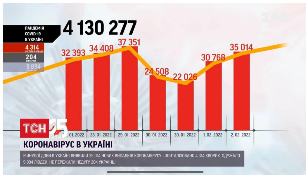
Рис. 2.2.1.8 Анімована графіка статистики захворюваності в Україні.

Після «Сніданку з 1+1» був новинний випуск Телевізійної Служби Новин. У цей ефірний час подали розширений варіант ранішезгаданих новин та оновлену статистику щодо захворюваності на коронавірус (рис. 2.2.1.8). Інформація подана у вигляді анімованої графіки.