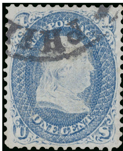
Рисунок А.17 – Марка «Святий грааль» (The Benjamin Franklin Z Gril), вартістю в $3 млн.