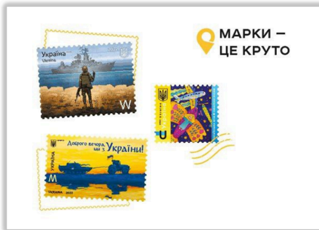
Рисунок А.5 – Арт листівка «МАРКИ – ЦЕ КРУТО!»