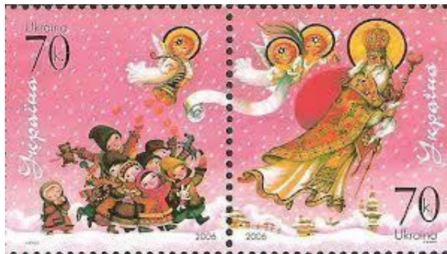
Рисунок А.11 – Зчіпка »День Святого Миколая»