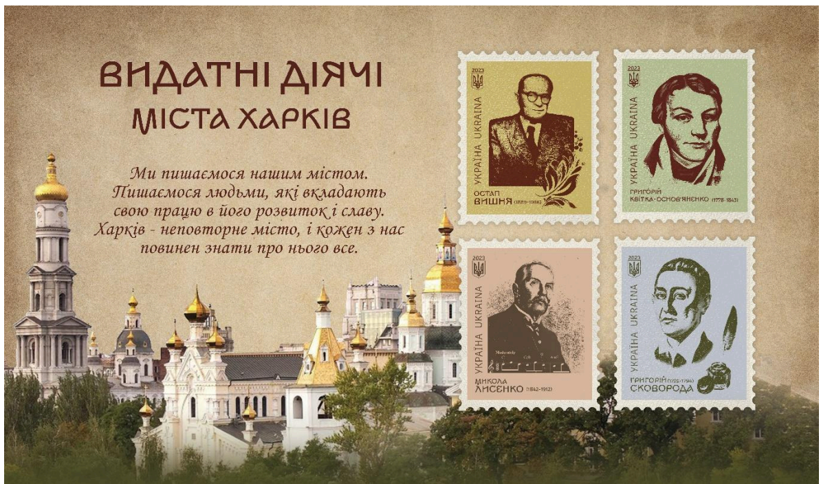
Рисунок В.2 — Оформлення марок