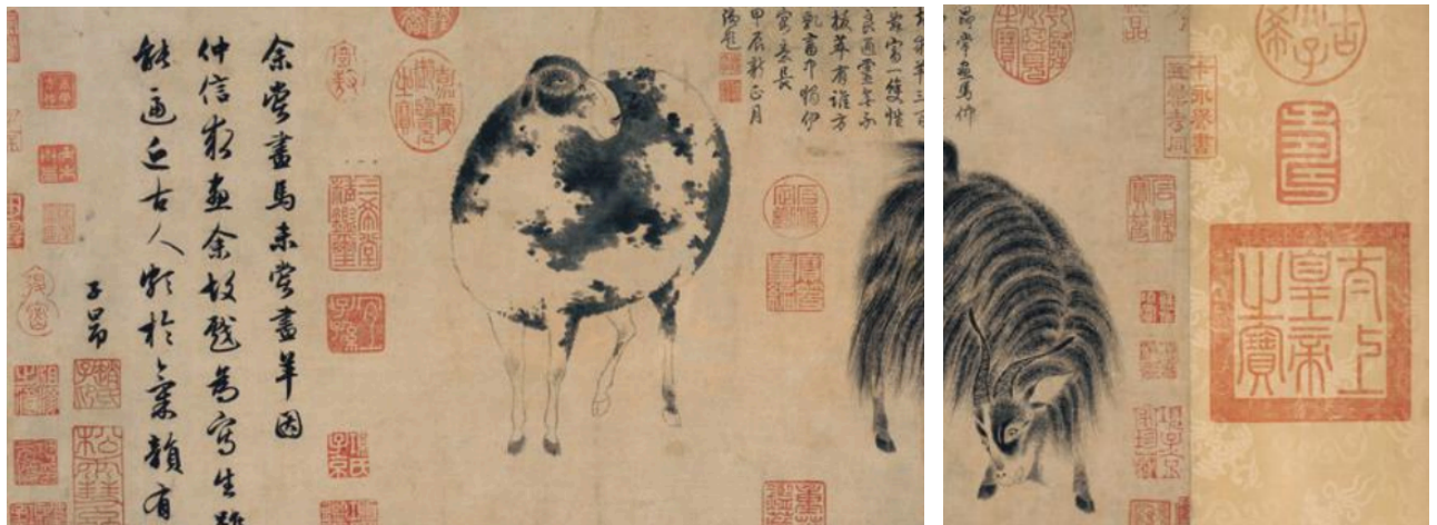
Рисунок А.2 – Чорнильний малюнок вівці й кози китайського вченого і державного діяча Чжао Менфу (1254–1322 рр.)