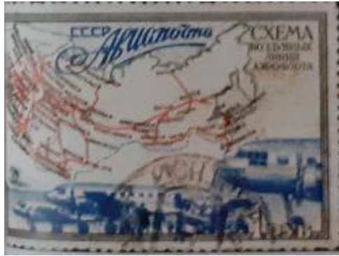
Рисунок Б.4 – Марка. Харківщина 1949 р.