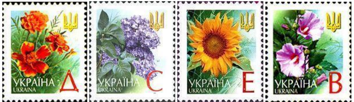
Рисунок 1.3 – Колекція марок «Квіти» (Чорнобривці, Бузок, Мальви, Соняшник)

Акварель — інша водорозчинна фарба, яка відрізняється від гуаші своєю ніжністю та прозорістю. Акварельні фарби розчиняються в воді, і вони наносяться на спеціальний акварельний папір. Ця техніка відома своєю здатністю передавати світлотінь та прозорість, що робить акварельні поштові мініатюри особливо чуттєвими та естетичними. Прикладом використання акварелі у поштовому мистецтві може бути серія листівок із зображеннями квітів (див. рис.1.3). Акварель дозволяє передати ніжність квітів та їх натуралістичний вигляд, створюючи враження свіжості та природної краси.