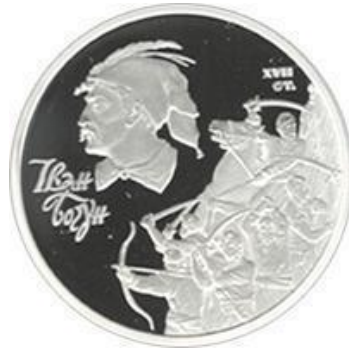
Рисунок Б.2 – Пам'ятна монета «Іван Богун» номіналом 10 гривень випущена в обіг 6 вересня 2007 р. (реверс.)

І. Богун, І. Гонта, І. Сірко, І. Підкова