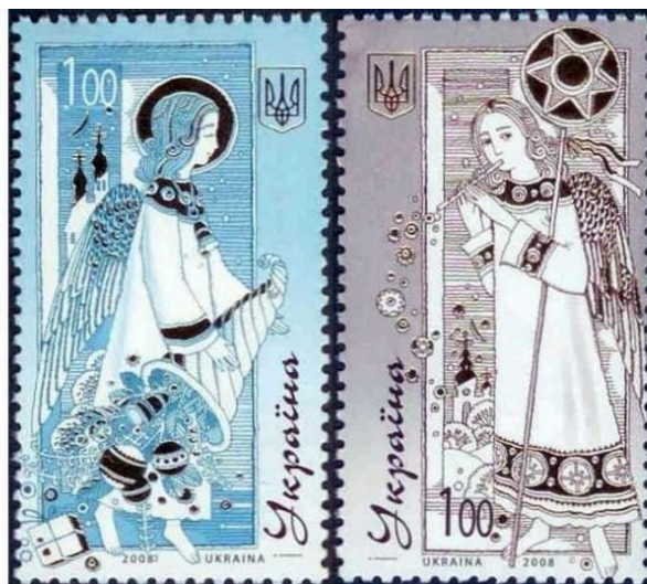
Рисунок А.6 – Виконані в однаковому стилі дві новорічні марки «З Новим роком!» та «З Різдвом Хрестовим!»