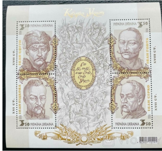
Рисунок Б.1 – Україна. 2006 р. Блок поштових марок Козацька Україна

І. Богун, І. Гонта, І. Сірко, І. Підкова