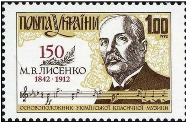
Рисунок Б.7 – Марка на честь М. Лисенка