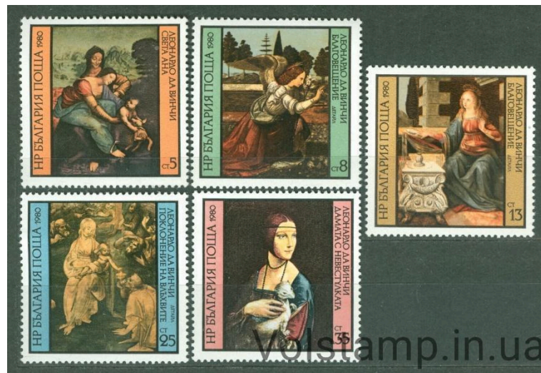
Рисунок А.12 – Болгарія серія марок (Картини Леонардо да Вінчі, живопис), 1980 р.