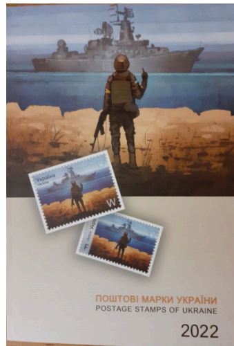
Рисунок 2.2 – Поштова марка 2022 р.