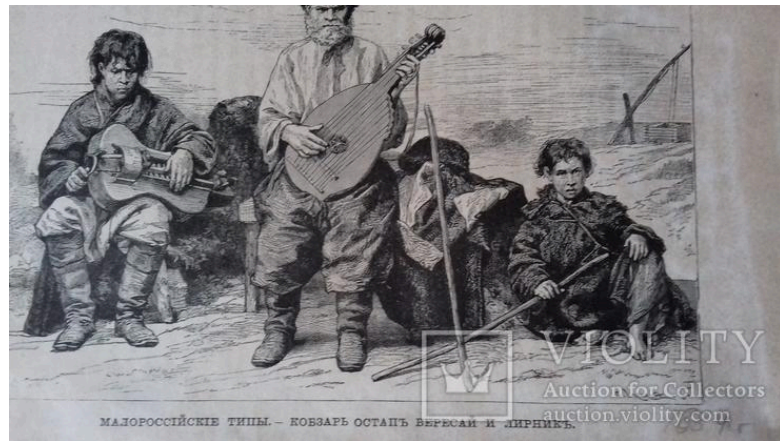
Рисунок А.7 – Старовина гравюра. Кобзар і Лірник, 1884 р.