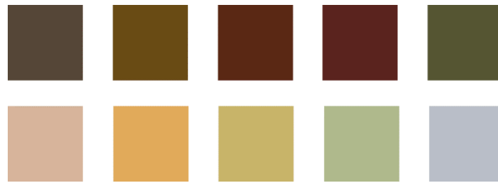
Рисунок 3.2 – Кольори проекту

Основний шрифт — Kyiv Region Type, це оригінальний вільний шрифт. Kyiv Region Type поєднує в собі давню історію та авангардні експерименти. Форми півуставу та скорописів, характерні для часів Київської Русі та українського бароко, поєднуються з конструктивізмом ХХ століття, який через сто років знову стає модним. Це сучасний геометричний шрифт без засічок зі штрихами, альтернативами, лігатурами та історичними формами, який можна вдало використовувати як в історичному контексті для написання текстів церковнослов'янською мовою, так і в сучасному дизайні.