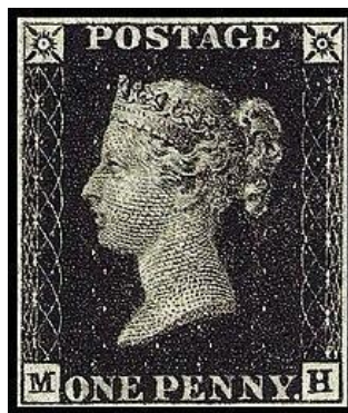
Рисунок 1.1 – Перша поштова марка «Чорний пенні»

У середньовіччі поштові послуги використовувались для розповсюдження релігійних ікон та ілюстрацій, що відіграли велику роль у поширенні християнства та розповсюдженні культурних цінностей. З часом поштове мистецтво розвивалося разом із технологічними досягненнями та змінами в суспільстві. У XIX та XX століттях з'явилися перші марки та листівки, що стали популярними серед колекціонерів та любителів мистецтва, вони включали різноманітні зображення, від пейзажів та портретів до абстрактних композицій. Перша поштова марка, відома як «Чорний пенні» була видана Великою Британією у 1840 році (див. рис. 1.1). Ця марка отримала свою назву через чорний колір та вартість одного пенні. Її випуск був революційною подією в історії філателії, оскільки вперше введено єдиний тариф для внутрішнього поштового обслуговування, і це дало початок системі передплати для користувачів поштових послуг. Чорний пенні також відомий своїм зображенням портрету королеви Вікторії і став однією з найбільш відомих та збираємих марок у світі.