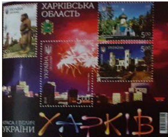
Рисунок Б.5 – Блок марок "Харківська область" 2018 р.