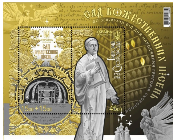
Рисунок Б.6 – Марка до 300 р. від дня народження Г. Сковороди