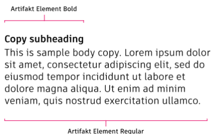
Рисунок 3.3 – шрифт Kyiv Region Type та Artifakt Element

Швидка буга лисця перестрибує ледачого пса