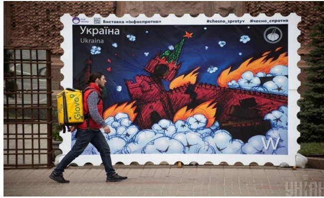
Рисунок А.13 – Цифрові технології у поштовому мистецтві