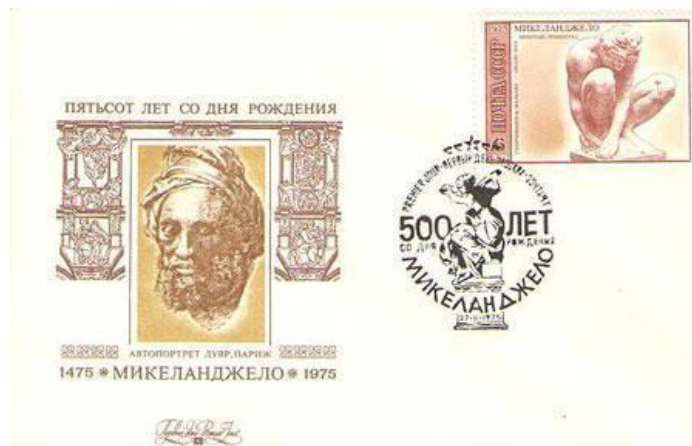
Рисунок А.15 – Експонат музею, конверт поштовий «500 років з дня народження Мікеланджело», 1975 р.