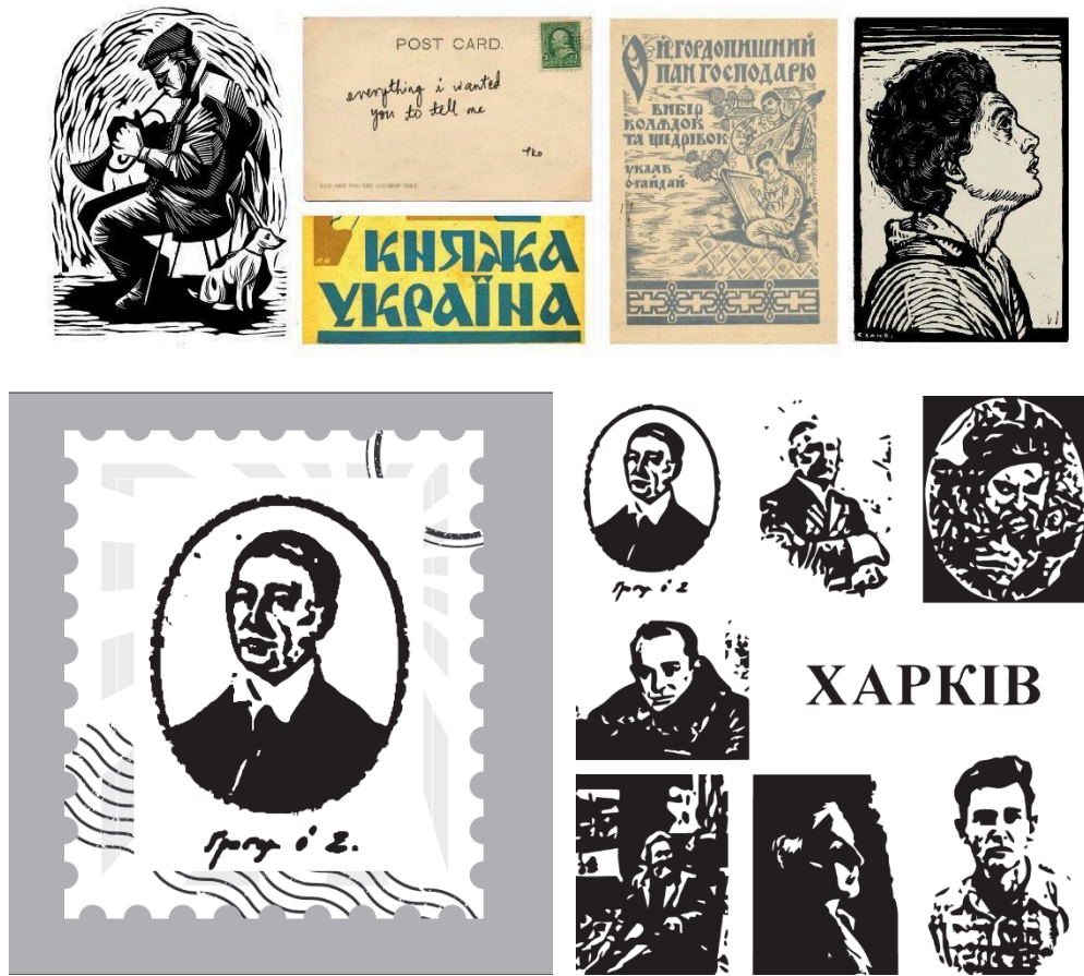
Рисунок В.1 — Ескіз поштової мініатюри із зображенням Г.С. Сковороди та мудборд