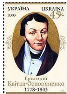
Рисунок Б.3 – Марка Г.Ф. Квітка-Основ'яненко Укрпошти 2003 р.