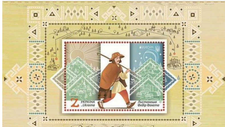
Рисунок Б.8 – марки "Федір листоноша"