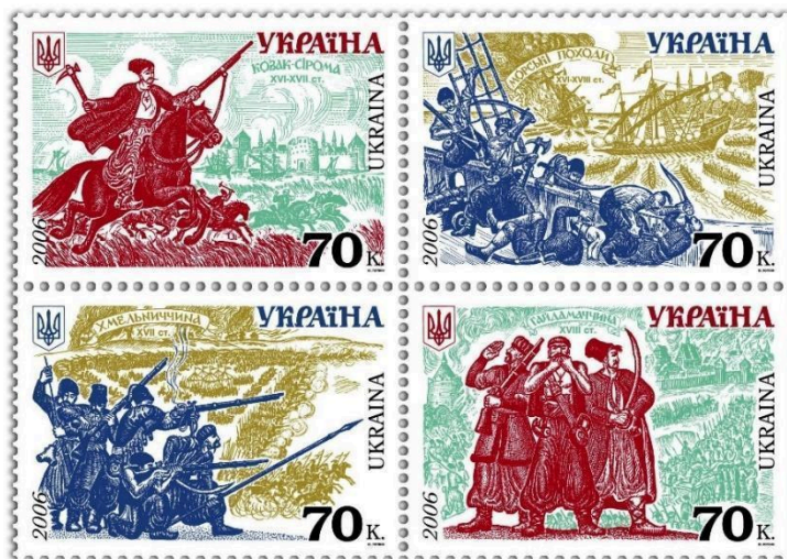
Рисунок А.9 – Зчіпка «Історія війська в Україні»