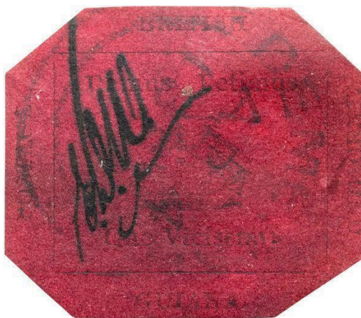
Рисунок А.16 – «Британська Гвіана» (British Guiana 1c magenta), найдорожча марка у світі вартістю в $9,48 млн