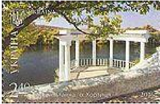
Рисунок А.10 – Серія «Краса і велич України»