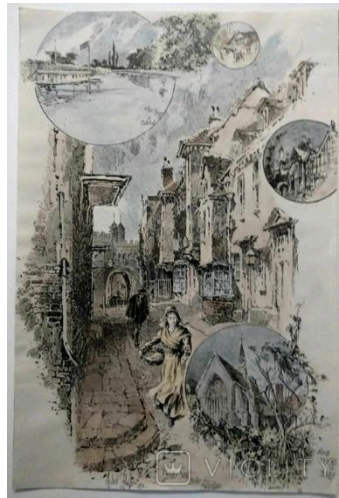
Рисунок А.8 – Літографія малюнок (22x34), 1893 р.