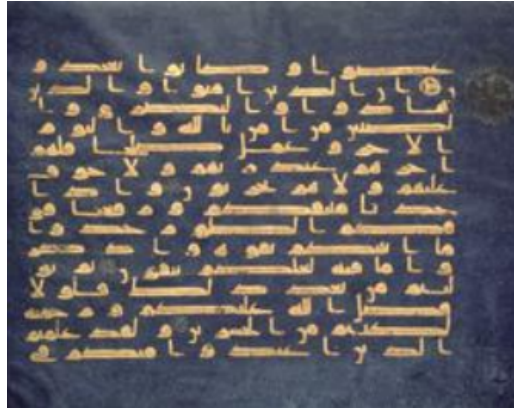
Рисунок А.1 – Сторінка з датованого Х століттям Корану з Північної Африки, написаного на пергаменті куфічним письмом