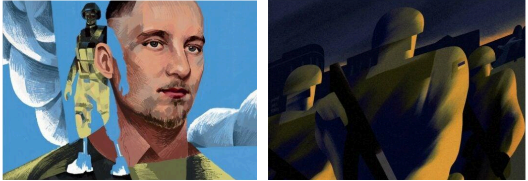
Рисунок А.4 – Укрпошта випустила 12 аудіолистівок про українських героїв та героїнь