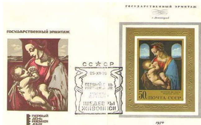
Рисунок А.14 – Експонат музею, конверт поштовий «Державний Ермітаж», 1970 р.