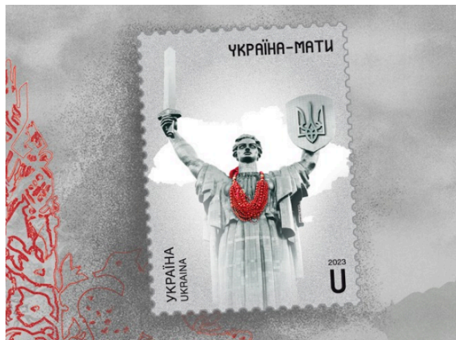
Рисунок 1.2 – Спеціальний поштовий випуск до 32-ї річниці незалежності України «Україна-мати»

Одним з аспектів вивчення символіки національної культури є розгляд того, як мистецькі вирази відображають національні традиції. Це може охоплювати національні костюми, танці, музичні жанри, які віддзеркалюють столітні традиції та культурні обряди. В мистецтві ці образи можуть бути відображені через живопис, скульптуру, музику та інші форми виразу. Наприклад, полотна художника, який відтворює національний одяг та танці, можуть стати способом збереження та популяризації національних традицій.