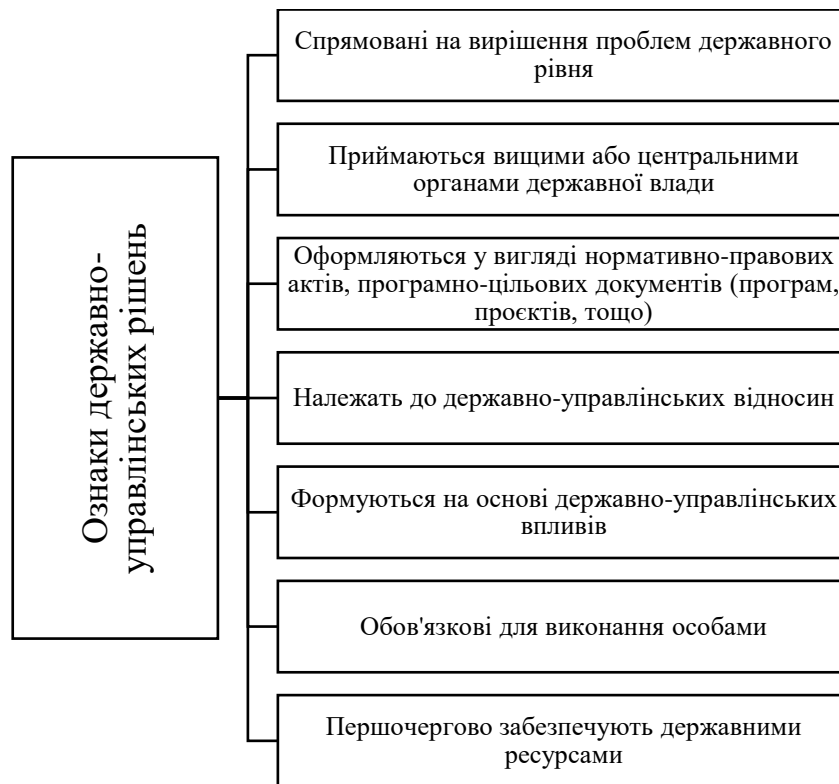
Рис. 2.1. Ознаки державно-управлінських рішень

Проведений аналіз різноманітних управлінських рішень, ухвалених на різних етапах державного управління, дозволяє класифікувати їх за формою та розподілити на три основні групи: