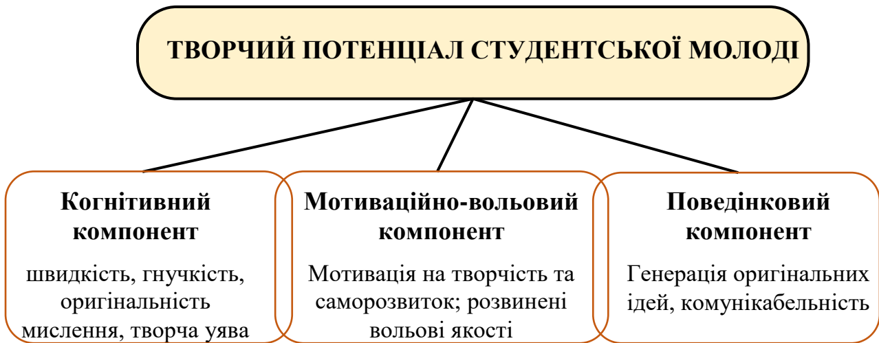
Рис. 2.1. Структурна модель креативності студентської молоді

На підставі аналізу наукової літератури щодо творчого потенціалу та врахування соціальної ситуації розвитку в студентському віці ми розробили структурну модель творчого потенціалу студентської молоді, до якої включили когнітивний, мотиваційно-вольовий та поведінковий компоненти (рис. 2.1).