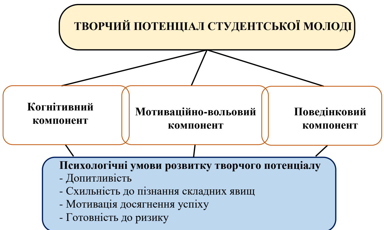
Рис. 2.2. Психологічні умови розвитку творчого потенціалу студентської молоді

щось нове значно впливає на рівень творчого потенціалу. Дж. Гілфорд поряд з іншими критеріями дивергентного мислення, виділив також оригінальність (допитливість, вміння відійти від стереотипів і шаблонів, висуваючи ідеї, відмінні від типових) та образність (складність мислення, вміння знаходити складне в тому, що здається абсолютно простим,) і бачити простоту там, де все виглядає складним.