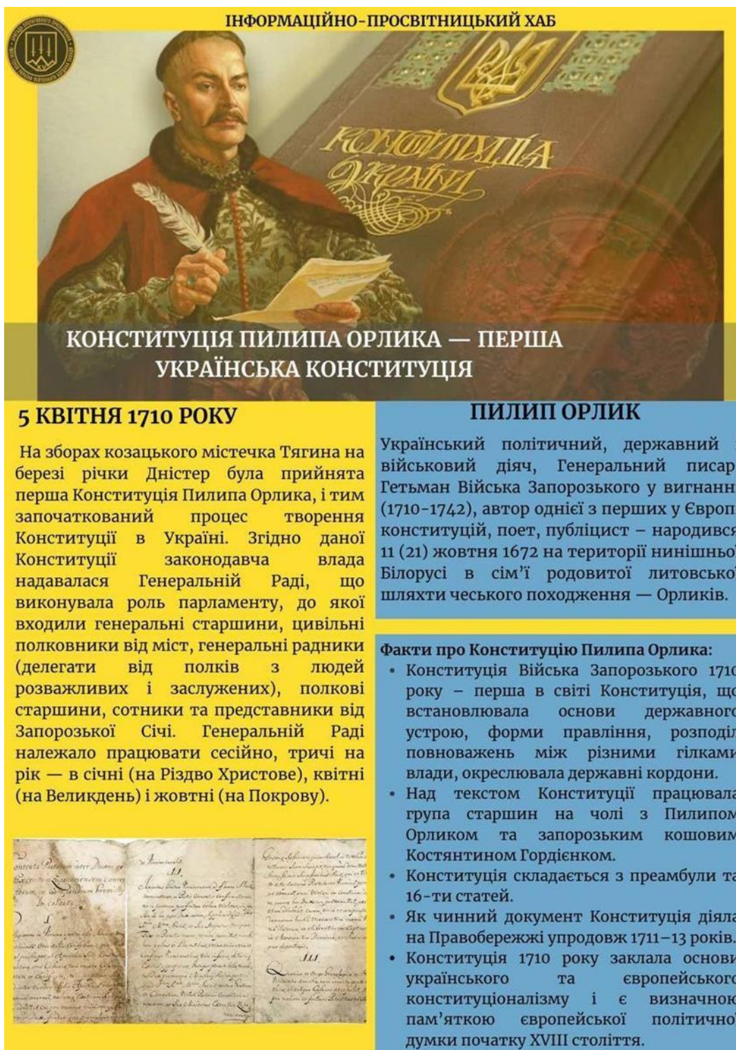
Рис. Б.2 – Матеріал «Конституція Пилипа Орлика - перша українська конституція»