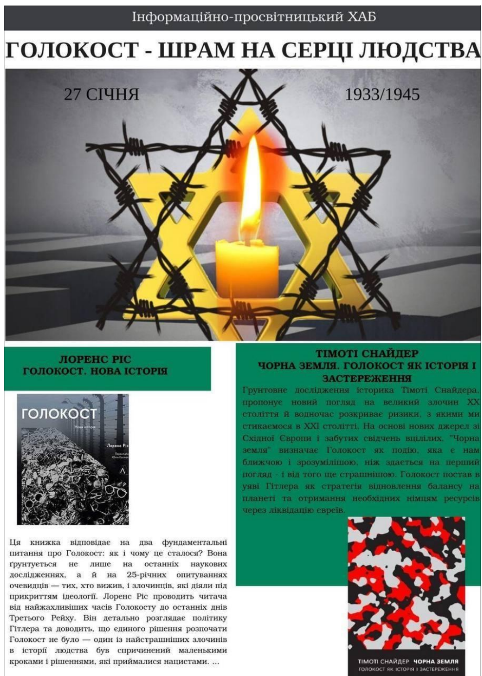
Рис. Б.7 – Матеріал «Голокост – шрам на серці людства»