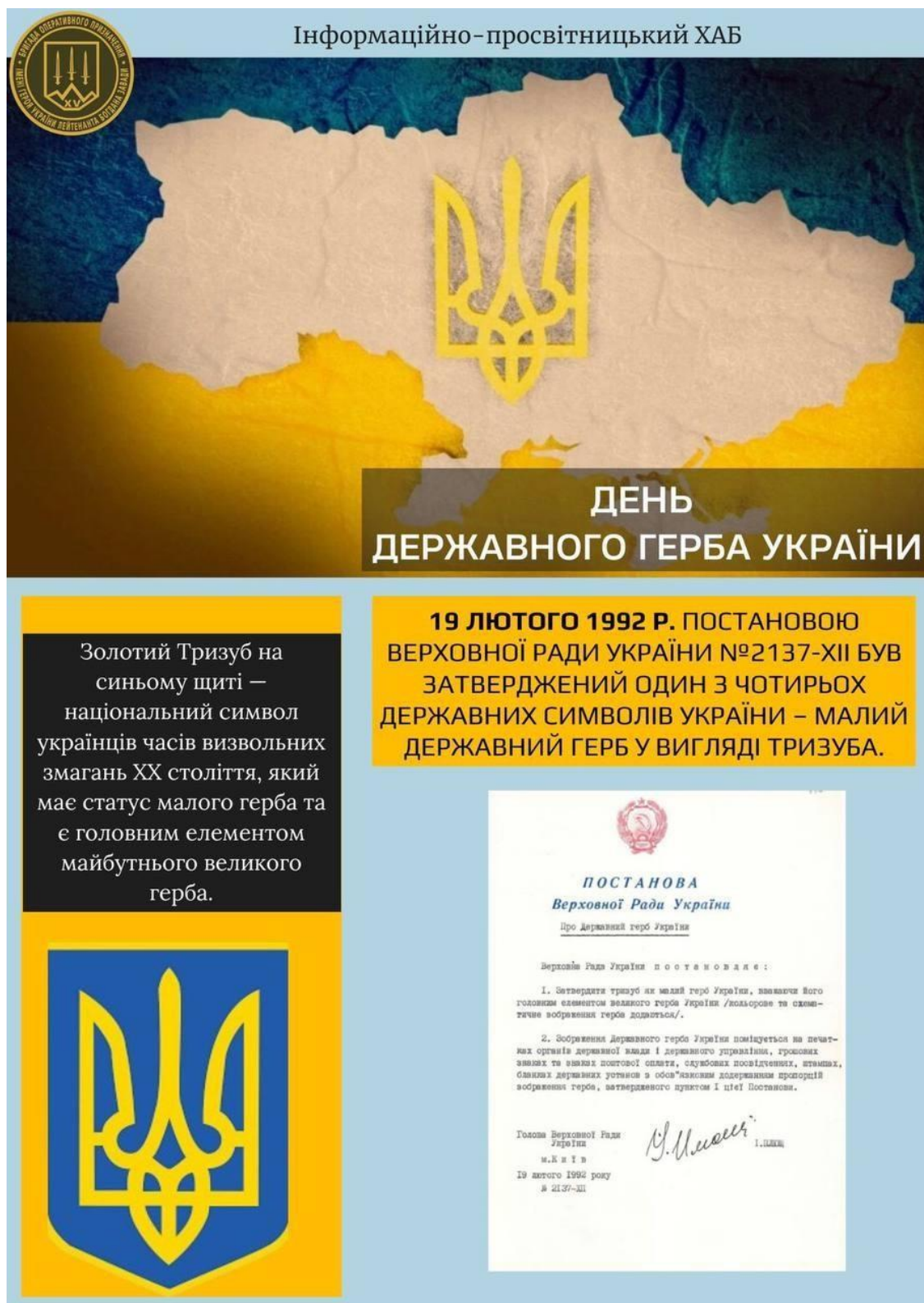
Рис. Б.5 – Пост до Дня Державного герба України