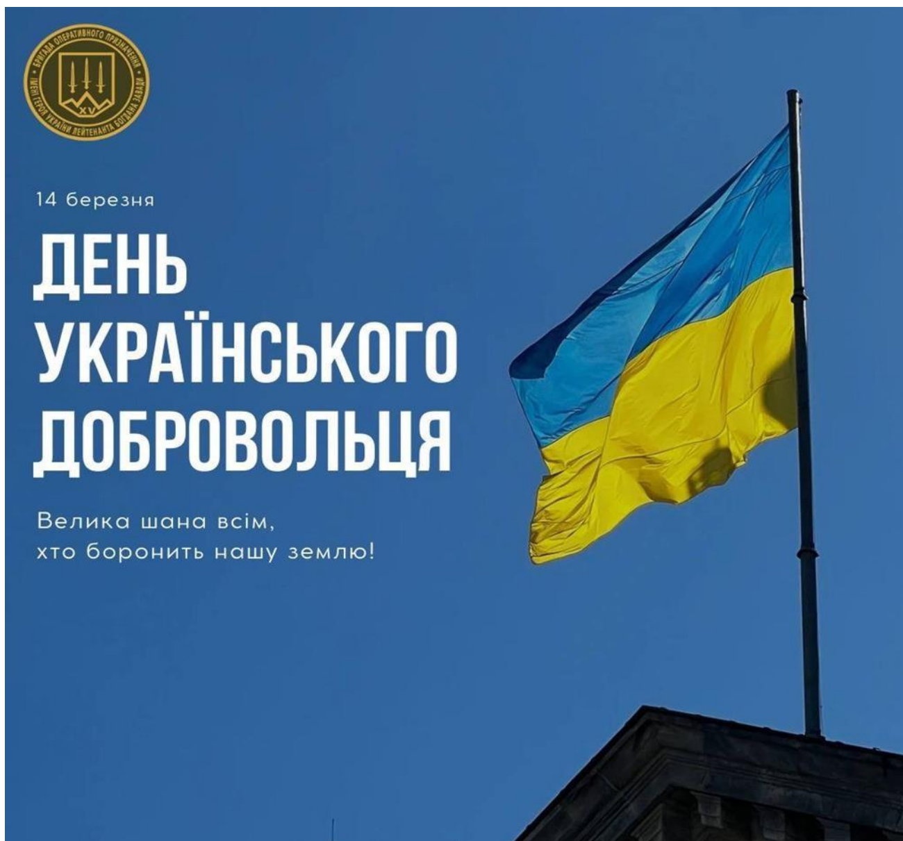
Рис. Б.3 – Пост для Фейсбук-сторінки до Дня українського добровольця