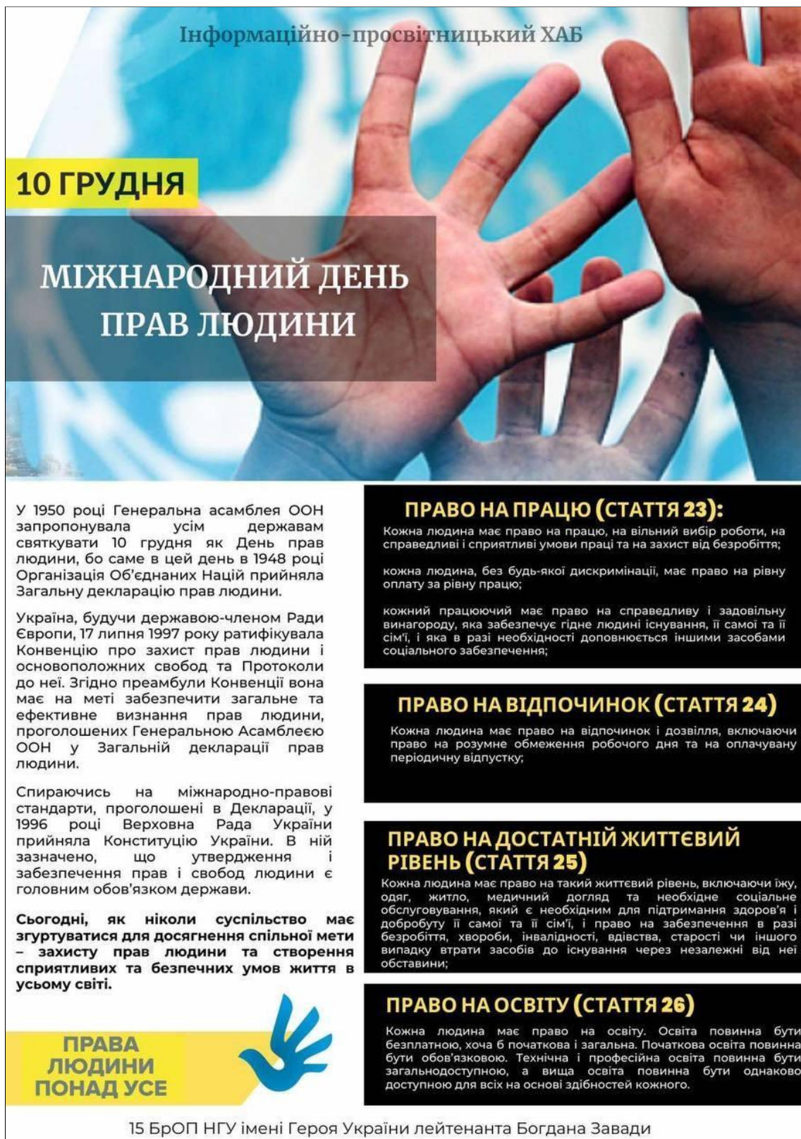
Рис. Б.8 – Фотоматеріал до Міжнародного Дня прав людини