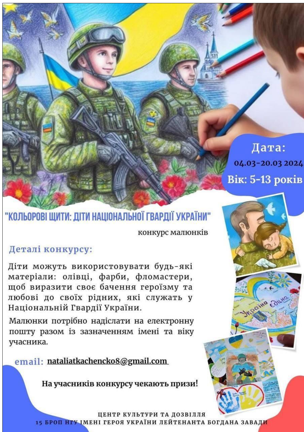
Рис. Б.4 – Матеріал про дитячий конкурс «Кольорові щити: діти Національної гвардії України»