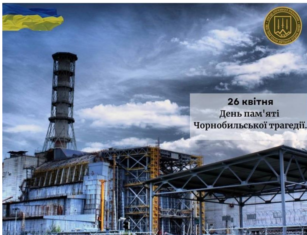
Рис. Б.1 – Пост для Фейсбук-сторінки до річниці трагедії на Чорнобильській АЕС