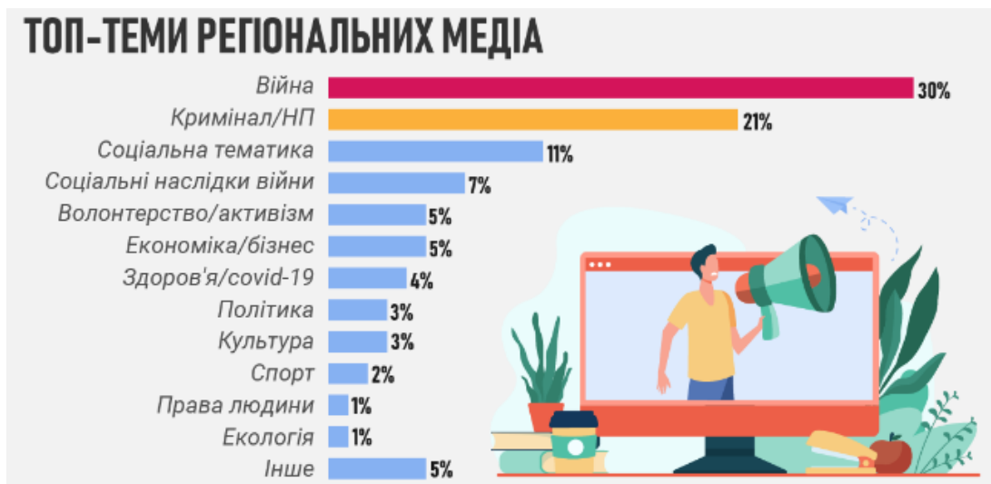
Рисунок 1.2.1 - Приклад статистики на сайті ІМІ за 2022 рік.

У серпні 2022 року, коли пройшло майже півроку з повномасштабного вторгнення, кількість спортивних новин ще більше зменшилася: основною тематикою були новини, які займали про війну, а спорт висвітлювався лише у 2% новин [15].