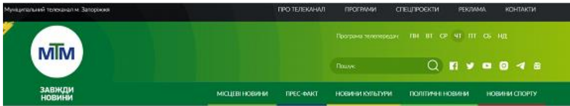
Рисунок.1.1.1 - Сайт телеканалу МТМ Запоріжжя.

За цей час телеканал став одним із лідерів телевізійного простору Запорізької області, забезпечує щодобово 24 години власного мовлення. Потенційна телевізійна аудиторія телеканалу - близько 900 тисяч глядачів-жителів обласного центру та прилеглих районів. Творча діяльність Телеканалу МТМ Запоріжжя будується на принципах оперативності, об'єктивності та неупередженості. Телеканал, не нав'язуючи власної думки, інформує про важливі події міського, регіонального та загальноукраїнського рівня .