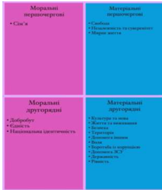
Рис. 2.6 Матриця цінностей загальнодержавного рівня після початку повномасштабного вторгнення

Спираючись на отриманні данні, можна прослідкувати як за кількісними, так і за якісними змінами. По-перше – значно змінилася кількість як матеріальних так і не матеріальних цінностей. В питанні про цінності у довоєнний період видів матеріальних цінностей було виділено значно більше (на 12 одиниць) ніж під час повномасштабного вторгнення (де різниця лише у 2 одиниці). Проте, як ми бачимо матеріальні цінності все ж таки залишаються домінуючими у матриці молоді.