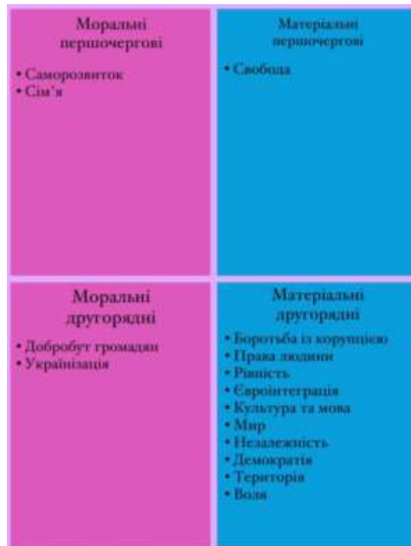
Рис. 2.5 Матриця цінностей загальнодержавного рівня до початку повномасштабного вторгнення

На основі цих даних також була сформована матриця цінностей (рис 2.4), яку надалі ми порівнюємо із тією, що отримуємо під час наступного етапу опитування, а саме дослідження цінностей загальнодержавного рівня після початку повномасштабного вторгнення.