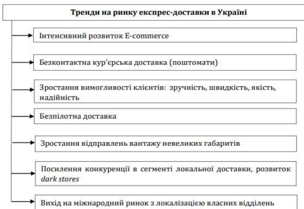
Рис. 1.1 Основні тренди ринку експрес-доставки в Україні

Одним із найбільших трендів сьогодні є безконтактна кур'єрська доставка. Кінцевому споживачеві пропонується найбільший асортимент безконтактних товарів. Експрес-доставка набирає все більшої популярності та активно розвивається.