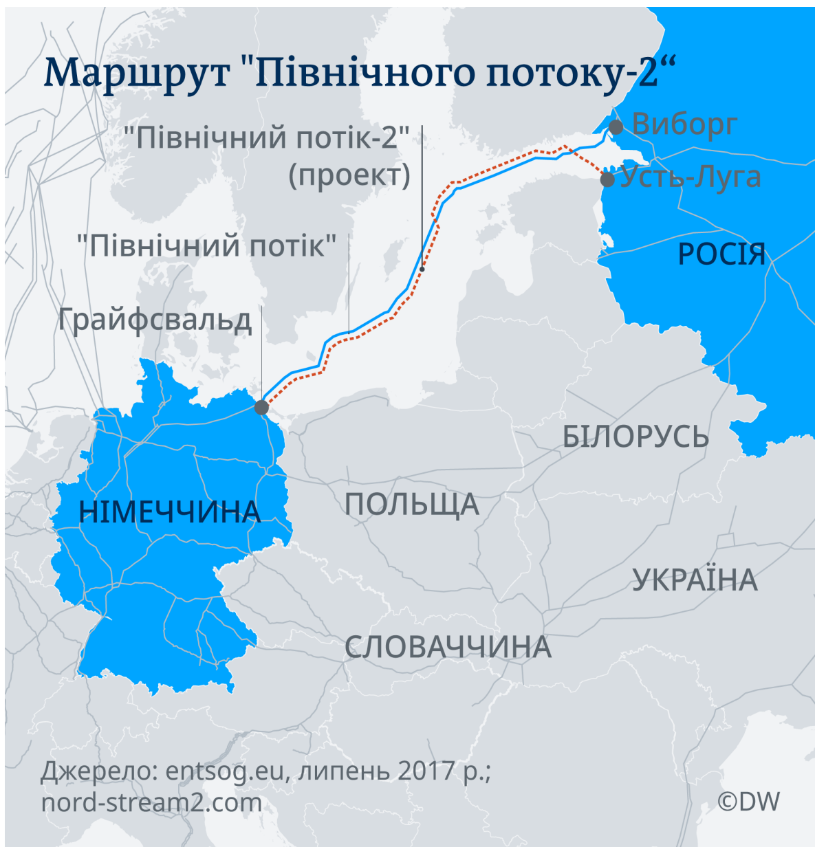
Мал. 1. Маршрут газопроводу «Північний потік – 2»