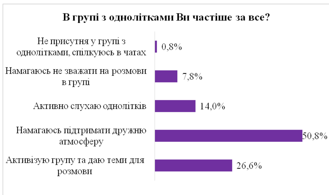
Рис. 3.2. Характерні прояви поведінки у реальному спілкуванні з

Результат дослідження відповідей респондентів, щодо їх поведінки у реальному спілкуванні з однолітками є цілком позитивним, а саме 50,8% опитуваних зазначили, що вони намагаються підтримати дружню атмосферу в групі, і лише 7,8% зазначили, що намагаються не зважати на розмови в групі. Тобто показник замкнутості у спілкуванні з однолітками є відносно низьким (див. рис. 3.2).