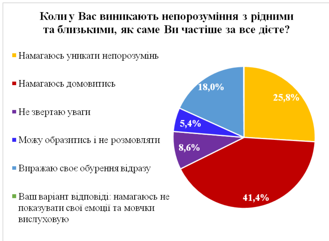
Рис 3.3. Навички молоді конструктивно вирішувати конфлікти з рідними та друзями

Аналізуючи результати дослідження щодо вміння конструктивно вирішувати конфлікти з рідними та друзями, слід відзначити спрямування молоді на конструктивне вирішення конфліктів. А саме, 41,4% опитуваних відзначили, що намагаються домовитись, при виникненні непорозумінь з рідними та близькими (див. рис. 3.3.).