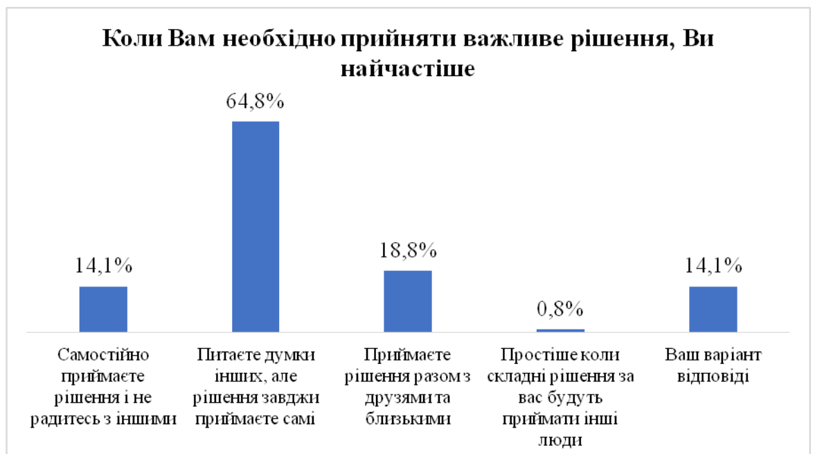
Рис. 3.6. Стилі поведінки молоді у ситуації прийняття важливого рішення

При цьому 84,6% опитаних студентів прислухаються до думки інших, однак рішення завжди приймають самі, серед учнів така кількість 59,8%, вони мають схильність приймати рішення разом з рідними (22,5%).