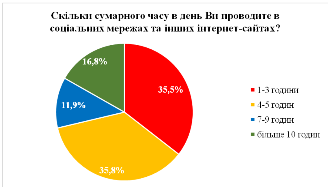
Рис. 3.1. Сумарна кількість годин в день, яку молодь проводить в соціальних мережах

Середній показник сумарного часу перебування молоді в соціальних мережах є досить значним і складає близько 5,5 годин. Виходячи з результатів опитування бачимо, що 1-3 години в соціальних мережах проводить 35,3% молоді, 4-6 годин в соціальних мережах проводить 35,5% молоді, 7-9 годин в проводять – 11,8%, більше 10 годин проводить в соціальних мереж 16,7% опитаної молоді, серед якої 3 особи зазначили, що час їх проведення в соціальних мереж є 24 години (див. рис. 3.1.).