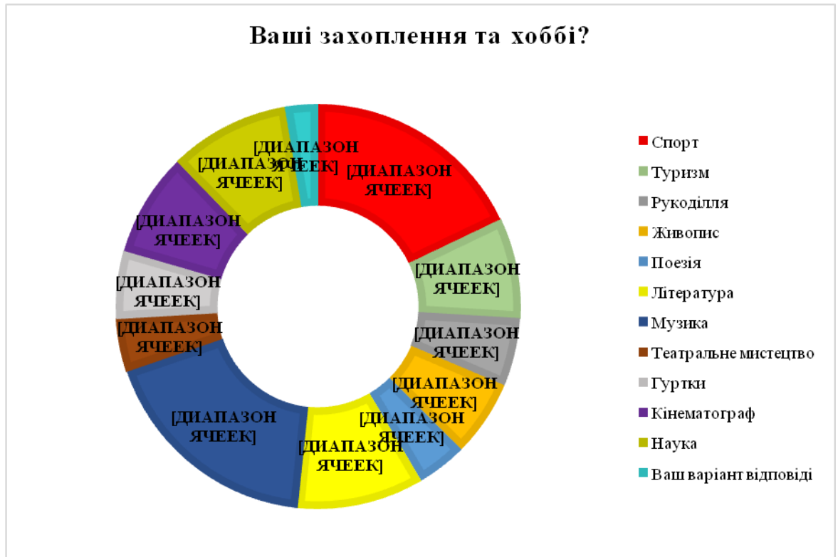
Рис. 3.7. Хобі молоді

рис. 3.7.). Так спираючись на переваги частоту вибору запропонованих видів занять, то 77 осіб (60,1%) захоплені музикою, 76 осіб (59,4%) займаються спортом, 43 особи (33,6%) захоплюються літературою. Менше за все молодь цікавить поезія (17 осіб – 13,3%) та театральне мистецтво (18 осіб – 14,1%).