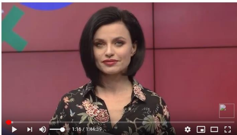
«Ранок з TV5» 30 10 2019