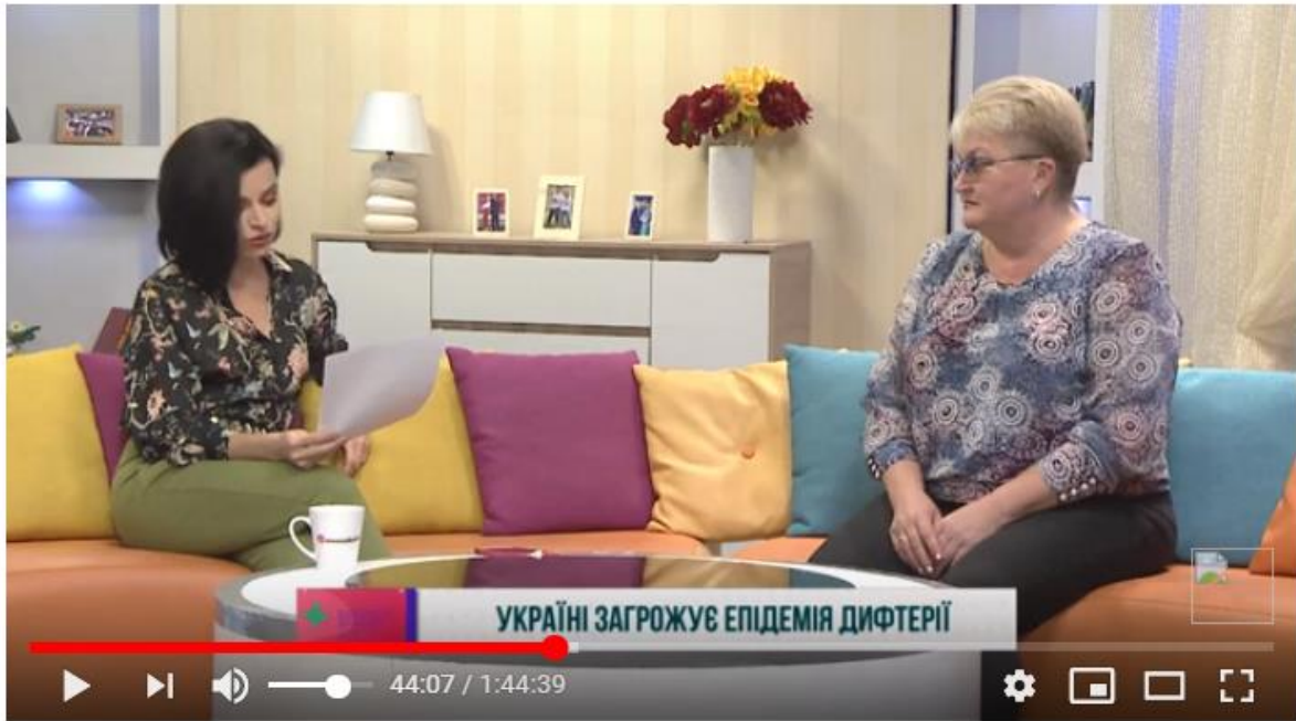
Рис. 3.2.3. Приклад режисерського задуму розташування гостей в студії