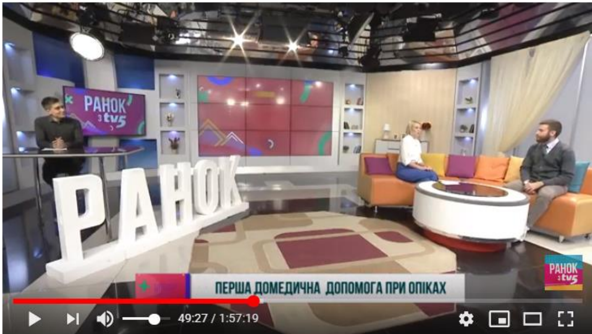
«Ранок з TV5» 07.10.2019

наприклад, вимкнув звук на телевізорі (за допомогою крупності кадрів, міміки ті жестів ведучого). Якщо ці дві складові збігаються і «працюють» одночасно – це сприяє найбільш комфортному сприйманню інформації глядачами.