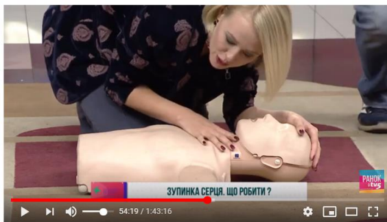
«Ранок з TV5» 25.09.2019

Далі завдання режисера – контролювати показ крупного плану, адже дії гостя неможливо передбачити і важливо миттєво зреагувати на подальші зміни в кадрі (Рис.3.2.6).