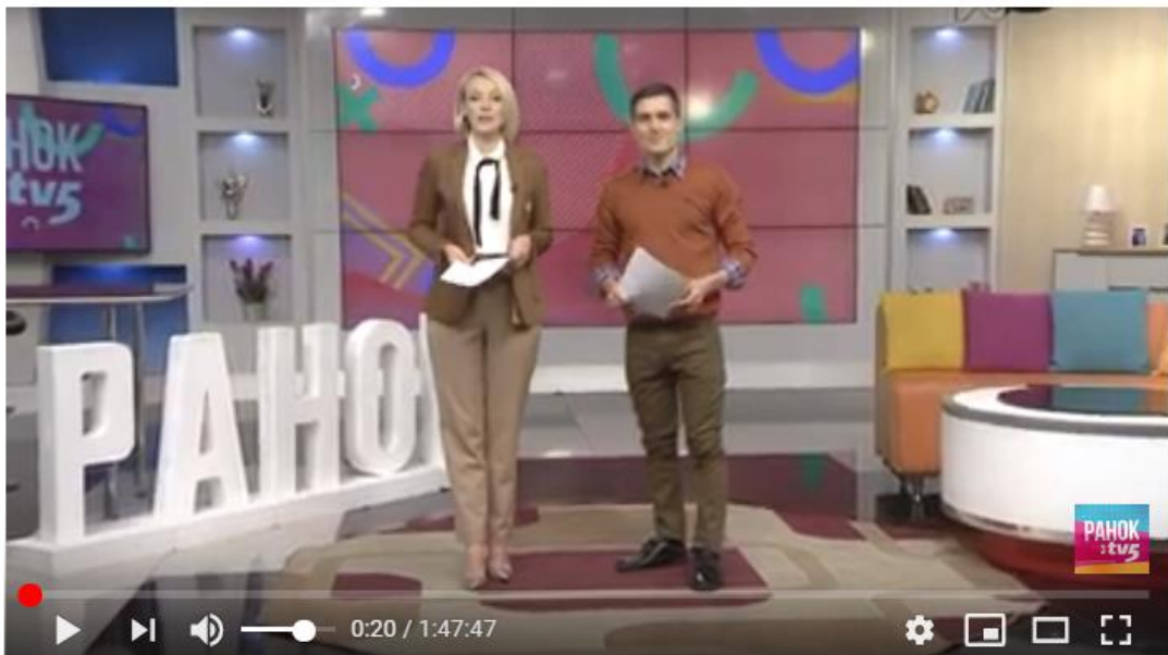
Рис. 3.2.1. Простір (студія) для реалізації режисерської майстерності

Майданчик режисерської діяльності передбачає зміну положень, адже простір студії дозволяє рухатися ведучим, обирати нові локації та приймати декілька гостей під час ранкових ефірів. В цьому випадку етапи режисерської майстерності: задум та реалізація здійснені в межах програми «Ранок з TV-5». (рис. 3.2.1.) Також можна наголосити, що задум організації такої програми є прообразом «Сніданок з 1+1», що виходить на телеканалі «1+1».