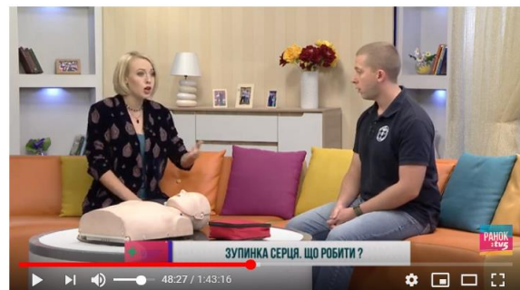
«Ранок з TV5» 25.09.2019