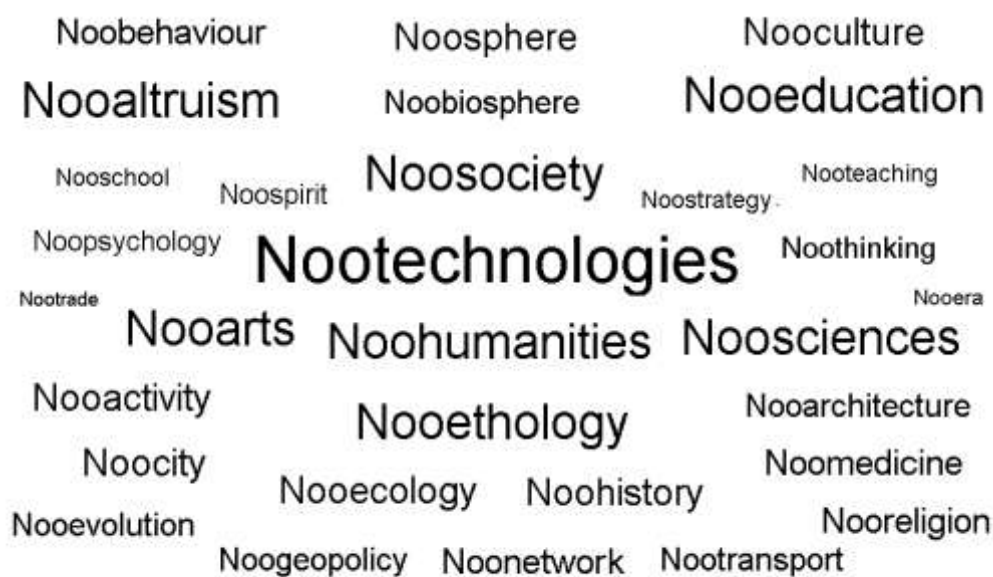
Рис.3. Англійський варіант частини створеної нами хмари ноотегів, що може стати основою другого цивілізаційного внеску українців у ноопрогрес усього людства

поєднання зростання чисельності людства з підвищенням якості життя кожного громадянина. Очевидно, що з цим рятівним для людства фундаментальним поняттям пов'язані багато інших, які ми поєднали у "нооглосарій (нооенциклопедію)" й отримали на нього авторське свідоцтво [3]. Загалом же - ні більше, ні менше, - ми фактично започаткували створення і поширення другої в історії українського народу колосальної за цивілізаційним впливом хмари тегів. Цього разу - ноотегів , які являють собою сотні нових понять і термінів, які в майбутньому обслуговуватимуть перехід Вітчизни і всього людства до ноосупільства, до мудрого співіснування людства з вилікуваною біосферою. Для полегшення поширення нашої пропозиції поза межі України на решту планети доцільно використати засоби сучасної інфографіки і надати читачам більш наочне відтворення хмари англійських ноотегів (рис.3).