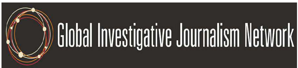
Рис. 3.1.2. Логотип Глобальної мережі журналістів-розслідувачів.

У 2015 році Миколаївський центр журналістських розслідувань став учасником Глобальної мережі журналістів-розслідувачів (Global Investigative Journalism Network).