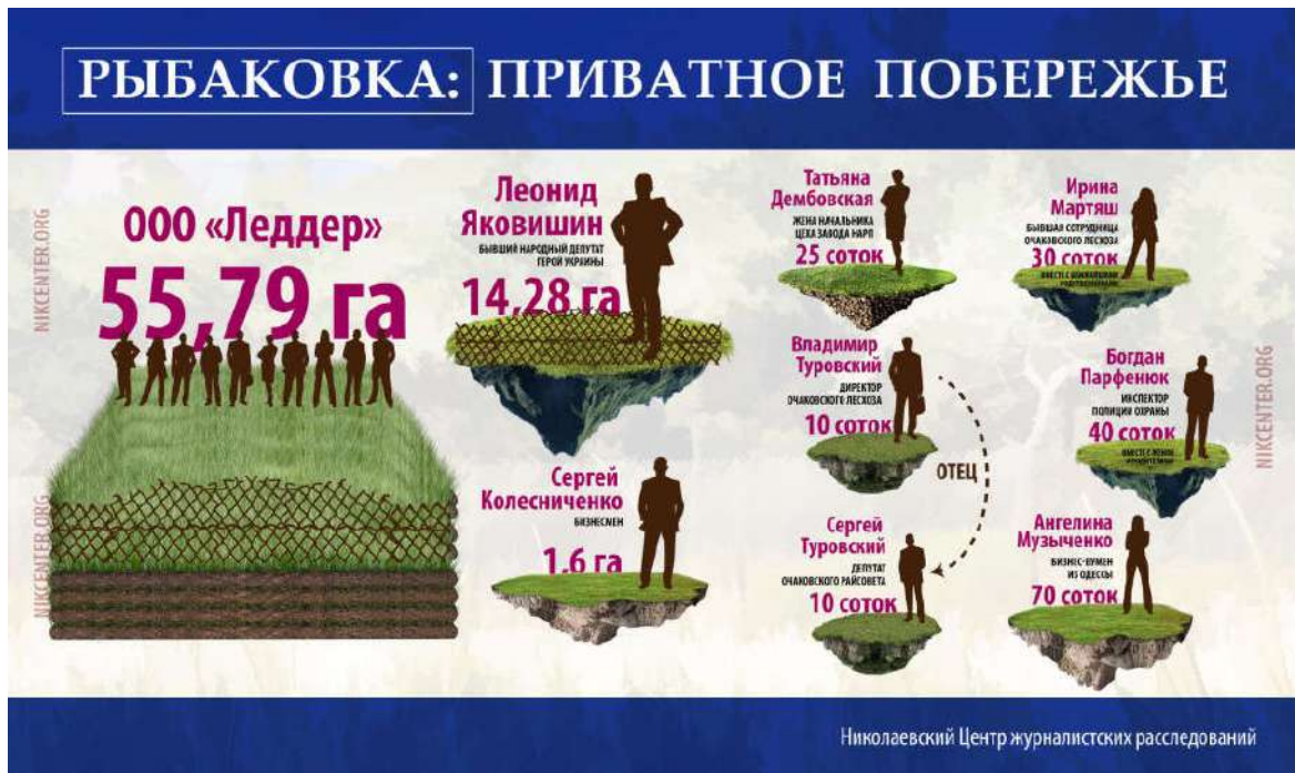
Рис. 3.3.2. Инфографіка до журналістського розслідування «Операция имитация».

Друге журналістське розслідування звертає увагу на неякісну роботу Управління капітального будівництва Миколаївської міської ради.