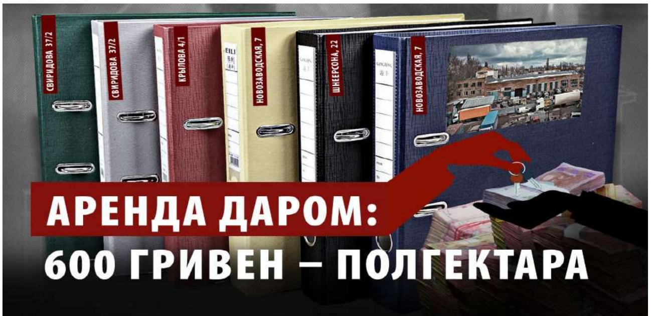
Рис. 3.2.2. Ілюстрація до журналістського розслідування «Аренда даром: 600 гривен – полгектара».

Велика кількість ілюстративного матеріалу також роблять текст цікавішим і яскравішим та набагато легшим для сприймання.