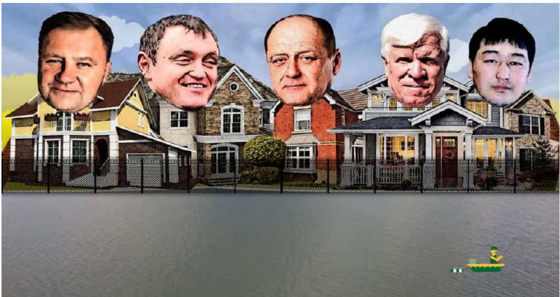
Рис. 3.3.3. Ілюстрація до журналістського розслідування «Потеряли берега».

Що ж посприяло результативності цього журналістського розслідування? По-перше, влучний і яскравий заголовок та інформативна ілюстрація (Рис. 3.3.3.). Автор розслідування «Потеряли берега» Яролав Чепурний використав прийом гри слів. Вислів «втратити береги» можна сприймати як буквально (натяк на прибережні території, які незаконно приватизували), так і фігурально («втратити береги» - втратити межі дозволеного).