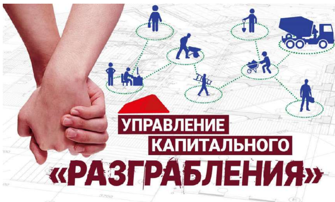
Рис. 3.3.2. Інфографіка до журналістського розслідування «Операция имитация».

Нарешті розслідування призвело до звільнення керівника Управління капітального будівництва Миколаївської міської ради, про що і повідомляє новинна публікація «В Николаевском управлении капитального строительства новый начальник» від 10.03.2021, посилаючись на Відділ інформаційного забезпечення мера Миколаєва.