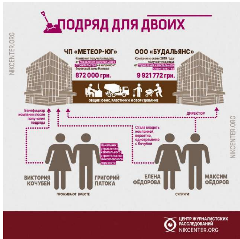
Рис. 3.3.2. Инфографіка до журналістського розслідування «Операция имитация».

У третьому розслідуванні журналісти Центру викривають незаконне забудовування землі бізнесменами, що спричинило відповідний судовий розгляд. Виявилось, що берег лиману, який за законом є комунальною власністю, фактично повністю забудований приватними помістями чиновників, бізнесменів і депутатів.