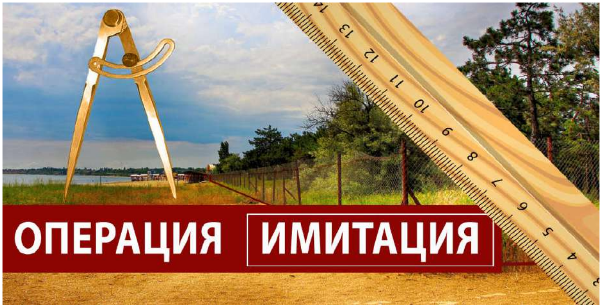
Рис. 3.3.1. Ілюстрація до журналістського розслідування «Операція імітація».

Загалом мова автора цього розслідування досить виразна, доступна і цікава, однак недоліком є перенасичення тексту цифрами та прізвищами, у яких легко заплутатися читачеві. Тут доречною стала інфографіка (Рис. 3.3.2), яку автор використав, аби допомогти розібратися у чиновницьких схемах.