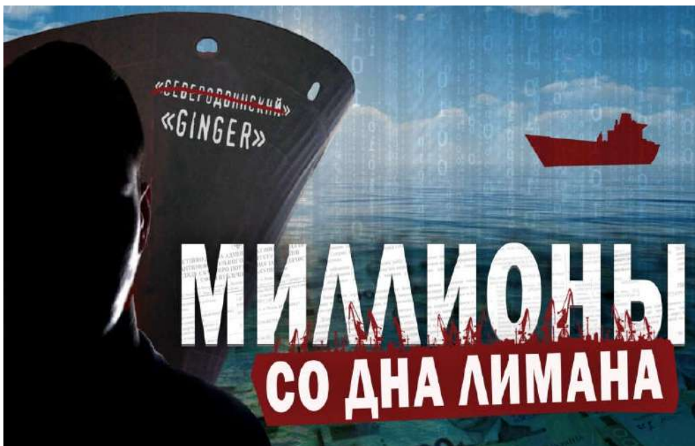
Рис. 3.2.1. Ілюстрація до журналістського розслідування «Миллионы со дна лимана».

Безумовно, є ще один важливий критерій якості журналістського розслідування – оформлення. Отже, спробуємо дослідити, наскільки матеріали Центру відповідають цим вимогам і як це впливає на їх якість. Для цього ми розглянемо приклади оформлення публікацій найгучніших розслідувань Миколаївського центру журналістських розслідувань, опубліковані в газеті «Рідне Прибужжя» у 2019-2021 роках.