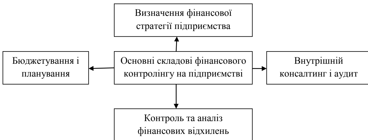
Рис. 2. Основні складові фінансового контролінгу на підприємстві

Фінансовий контролінг включає у себе ряд складових елементів. Надалі на рисунку 2 наведемо основні складові фінансового контролінгу на підприємстві.