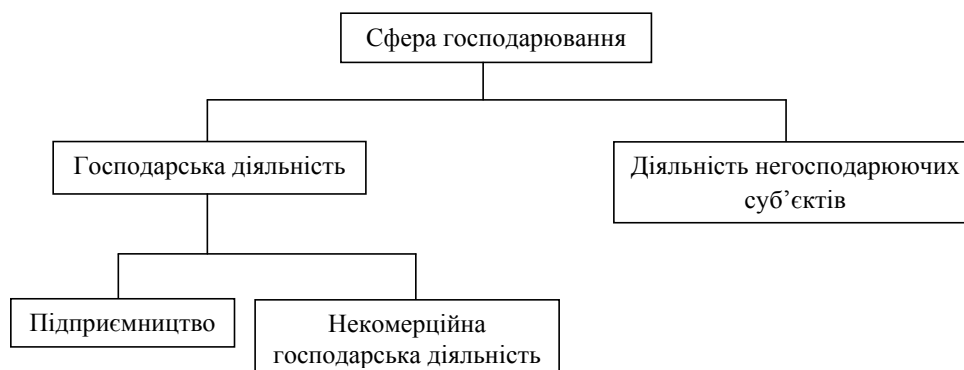
Рис. 1. Логічна схема правових термінів, що відображають сферу господарювання

зовнішнім середовищем» як абстрактні поняття пов'язані між собою, тому що обидва є складниками поняття «буття». У змісті поняття будь-якого явища другий із зазначених термінів характеризує певне явище як предмет, перший – як процес, третій – як відносини із зовнішнім середовищем, і таким чином разом розкривають форму буття відповідного суб'єкта. Специфіка використання у Господарському кодексі України першого та третього термінів полягає у тому, що у них частково розкрито зміст поняття «сфера господарювання» і як процесу, і як відносин із зовнішнім середовищем. Зазначені