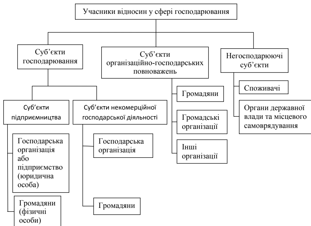
Рис. 2. Логічна схема правових термінів, що відображають склад учасників відносин у сфері господарювання