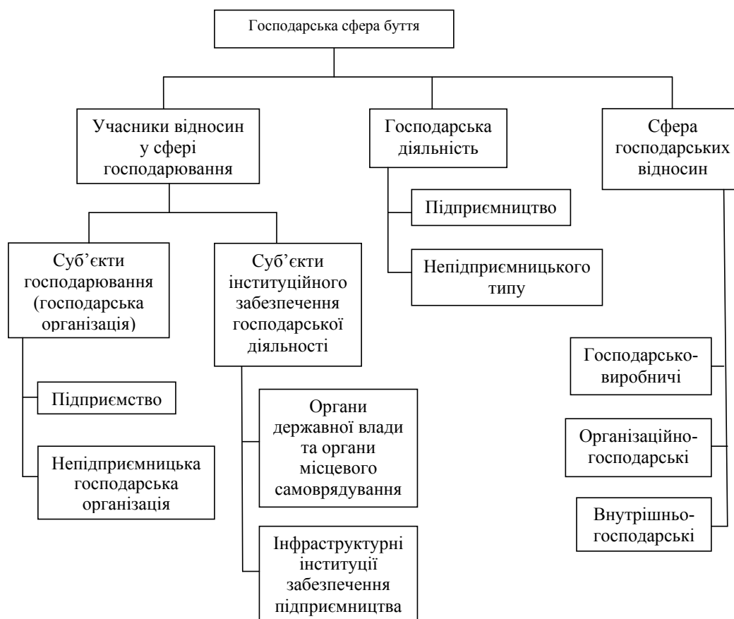
Рис. 4. Поліпшена структурно-логічна схема основних правових термінів Господарського кодексу України

Неправильне визначення правового й економічного статусу об'єднання підприємств як одного із типів суб'єктів господарювання призвело до хибного тлумачення змісту та класифікації видових форм цього економічного явища, що знайшло відображення у главі 12 розділу II Господарського кодексу України.