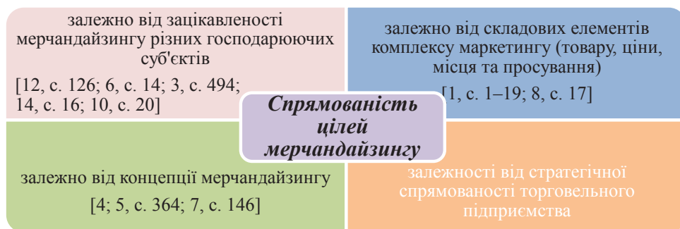
Рис. 2. Спрямованість цілей мерчандайзингу