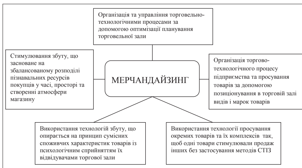
Рис. 1. Функції мерчандайзингу в системі маркетингового менеджменту

Також, враховуючі наявну неоднозначність розстановки ключових аспектів у визначенні цілей комплексу мерчандайзингу, доцільно розглядати цілі комплексу мерчандайзингу залежності від стратегічної спрямованості торговельного підприємства, оскільки стратегія – це стрижень в управлінні підприємством, який має забезпечувати стійке економічне зростання і розвиток підприємства, підвищення конкурентоспроможності та ін. Проте слід зауважити, що стратегія комплексу мерчандайзингу повинна бути уособленням