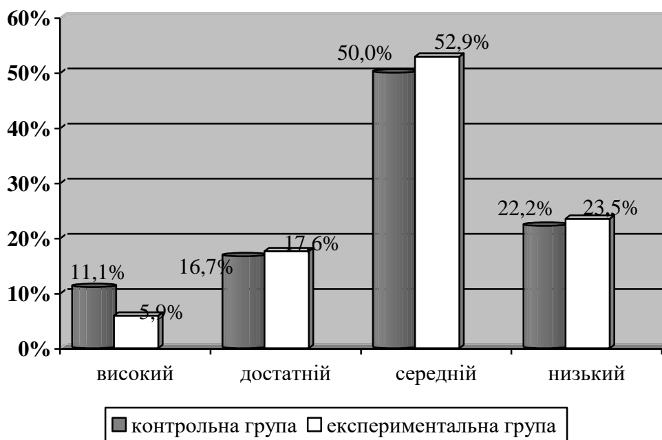
Рис. 2.1. Рівні гендерної культури студентів технічних спеціальностей контрольної та експериментальної груп (констатувальний етап)

За результатами контрольних робіт, бесід, тестування та опитування нами встановлено загальний рівень гендерної культури студентів технічних спеціальностей експериментальної та контрольної груп ( рис. 2.1.).