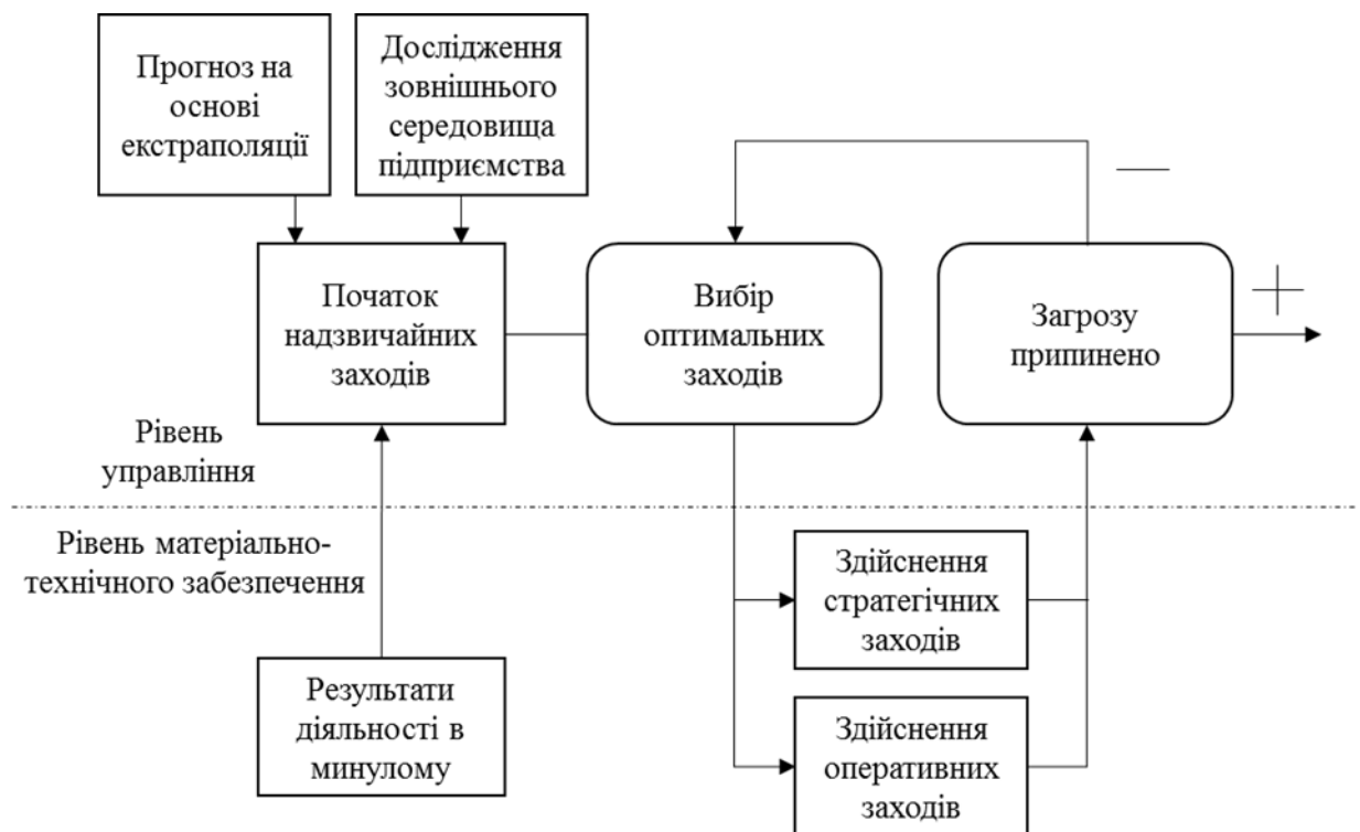
Рис.1. Загальна схема реалізації інтерактивного антикризового управління на КТ «Запорізький завод високовольтної апаратури – Вакатов і компанія»

В основі реактивного антикризового управління лежить припущення, що труднощі можна здолати звичними, хоча б і радикальними оперативними контрзаходами. Така реакція передбачає послідовне застосування певних заходів, починаючи з тих, які в минулому були ефективними. Під час початкового діагностичного аналізу розглядаються можливості одночасного застосування оперативних і стратегічних заходів. Організація цього типу дає змогу реалізовувати ті чи інші заходи одночасно, що зображено на рисунку 1.