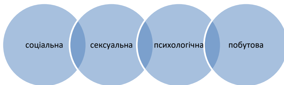
Рис. 1.1 Аспекти подружньої сумісності

Подружня сумісність є багатоплановою. Зазвичай виокремлюють кілька базових аспектів подружньої родинної сумісності: