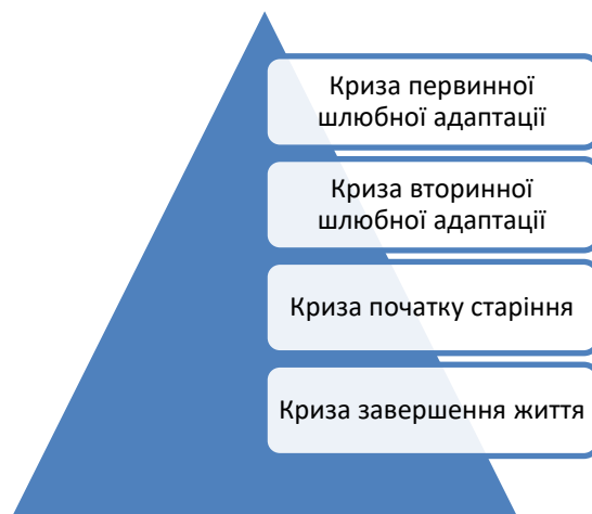
Рис.2.4. Нормативні кризи інфертильної (бездітної) родини

Нормативні кризи переживають всі родини, але по-різному. Водночас переживання нормативних родинних криз бездітними подружніми парами має свою специфіку [47]: