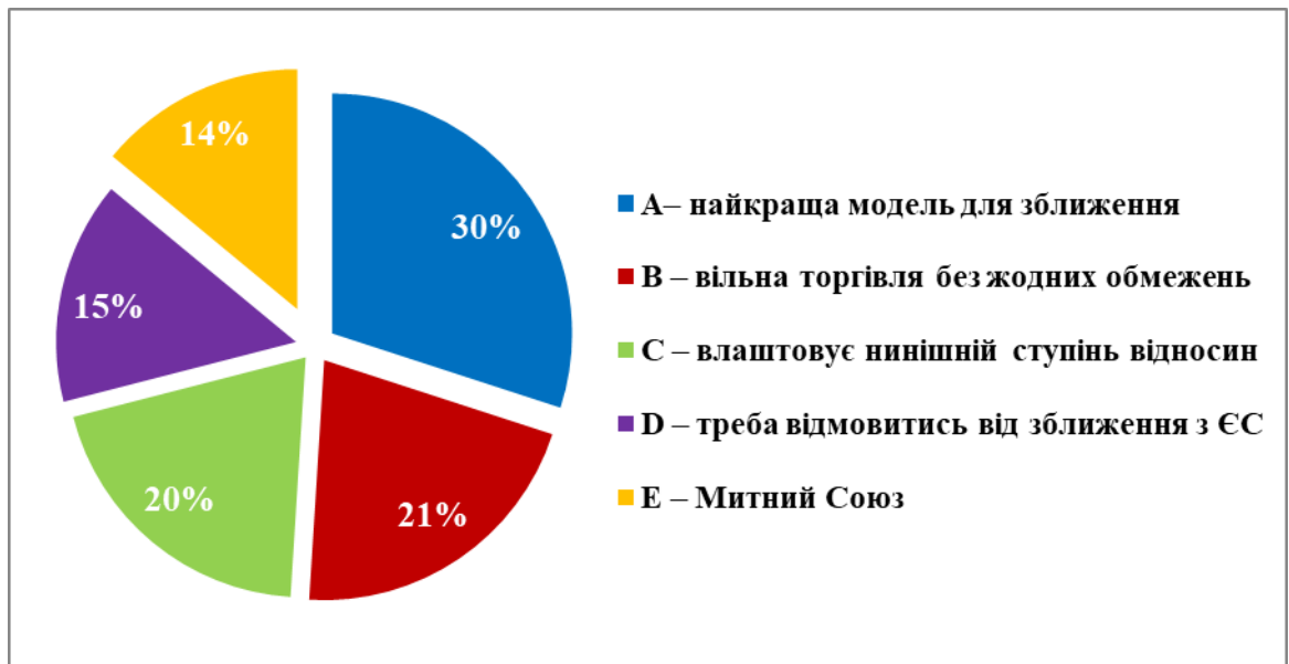
Рисунок 1.2 - Оцінка рівня обізнаності населення України про ЄС