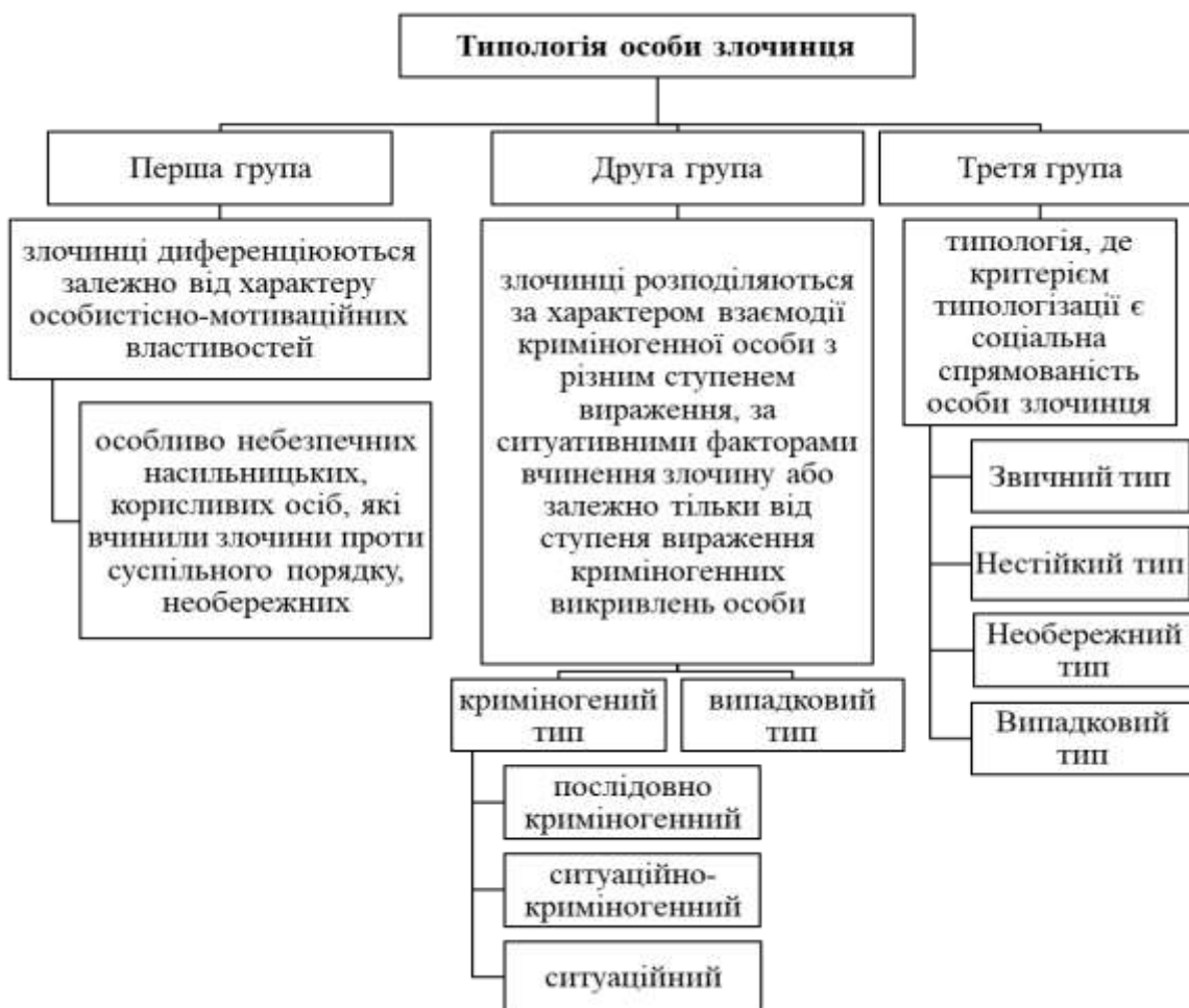
Рис. 1.1 Типологія особи злочинця

Також у літературі наводяться різні варіанти типології особи злочинця, що поділяються на групи залежно від критерію типологізації [6]. Так, наприклад, розрізняють три групи типології (рис. 1.1).