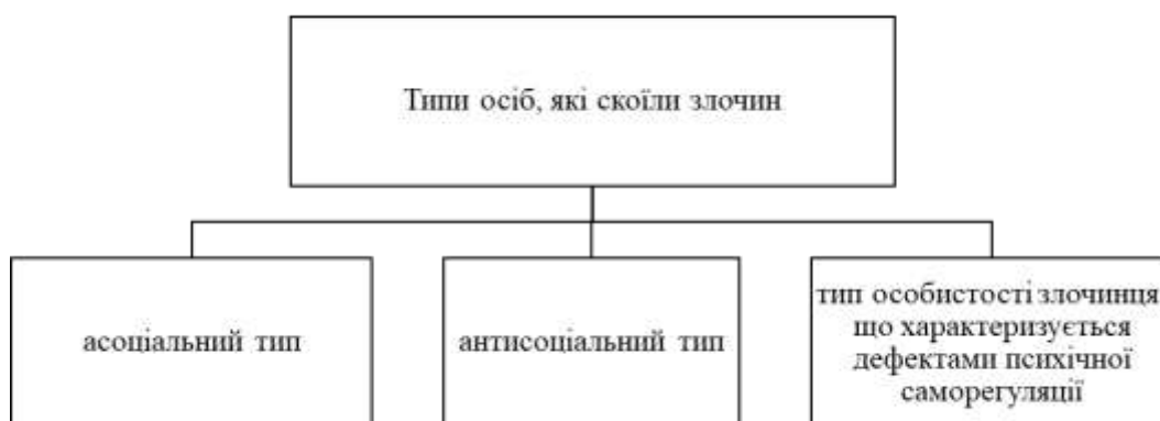
Рис 1.2 Типи осіб, які скоїли злочин

Судово-психологічна класифікація особистості охоплює такі типи правопорушників: асоціальний (менше злісний); антисоціальний (злісний); тип особистості злочинця, що характеризується дефектами психічної саморегуляції (випадковий) (рис. 1.2) [8].