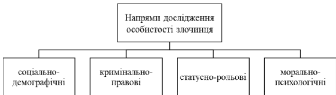
Рис. 1.3 Напрями дослідження особистості злочинця

Вивчення особистості злочинця неможливо без виділення характерних типів і груп осіб, які вчиняють протиправні діяння. Виділяються наступні основні напрями дослідження особистості злочинця: соціально-демографічні, кримінально-правові, статусно-рольові та морально-психологічні (рис. 1.3) [11].