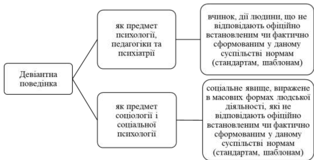
Рис. 1.4 Дефініції терміну «девіантна поведінка»

переважно предмет психології, педагогіки, психіатрії. В другому значенні – предмет соціології та соціальної психології. Зрозуміло, таке дисциплінарне розмежування відносне. Девіантна поведінка поділяється на дві групи: поведінка, яка відхиляється від норм психічного здоров'я (шизоїди, астеніки, епілептоїди; особи з акцентуаціями характеру); поведінка, що має відхилення від морально-правових норм, які виявляються у форму проступків і злочинів (рис.1.4).