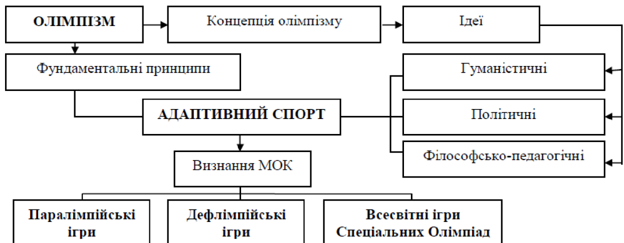
Рис.2. 1. Адаптивний спорт у міжнародному спортивному русі [16, с.13].

Аналізуючи розвиток міжнародного спортивного руху людей з обмеженими можливостями, можна зазначити, що ідеї Паралімпізму подібні ідеям Олімпізму. Певний час Паралімпійські ігри проводилися не лише не в столицях Олімпійських ігор, а й в інших країнах [23]. Тому нормативно-правова база щодо розвитку спорту включає в себе і аспекти паралімпійського напрямку (див. рис. 2.1).