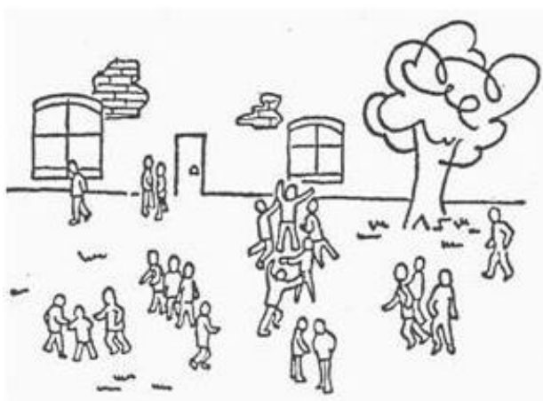
Рисунок А.2. – Діагностичний рисунок 2.