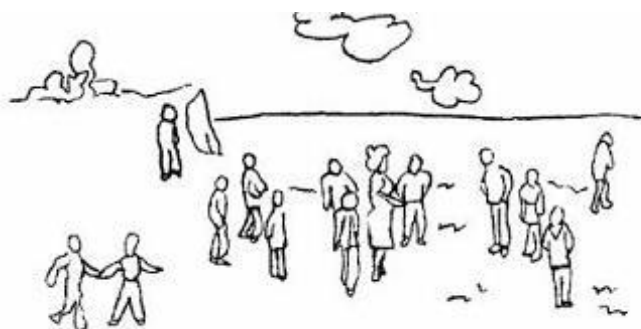
Рисунок А.3. – Діагностичний рисунок 3.