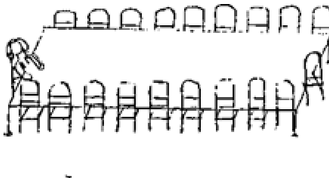
Рисунок А.1. – Діагностичний рисунок 1.