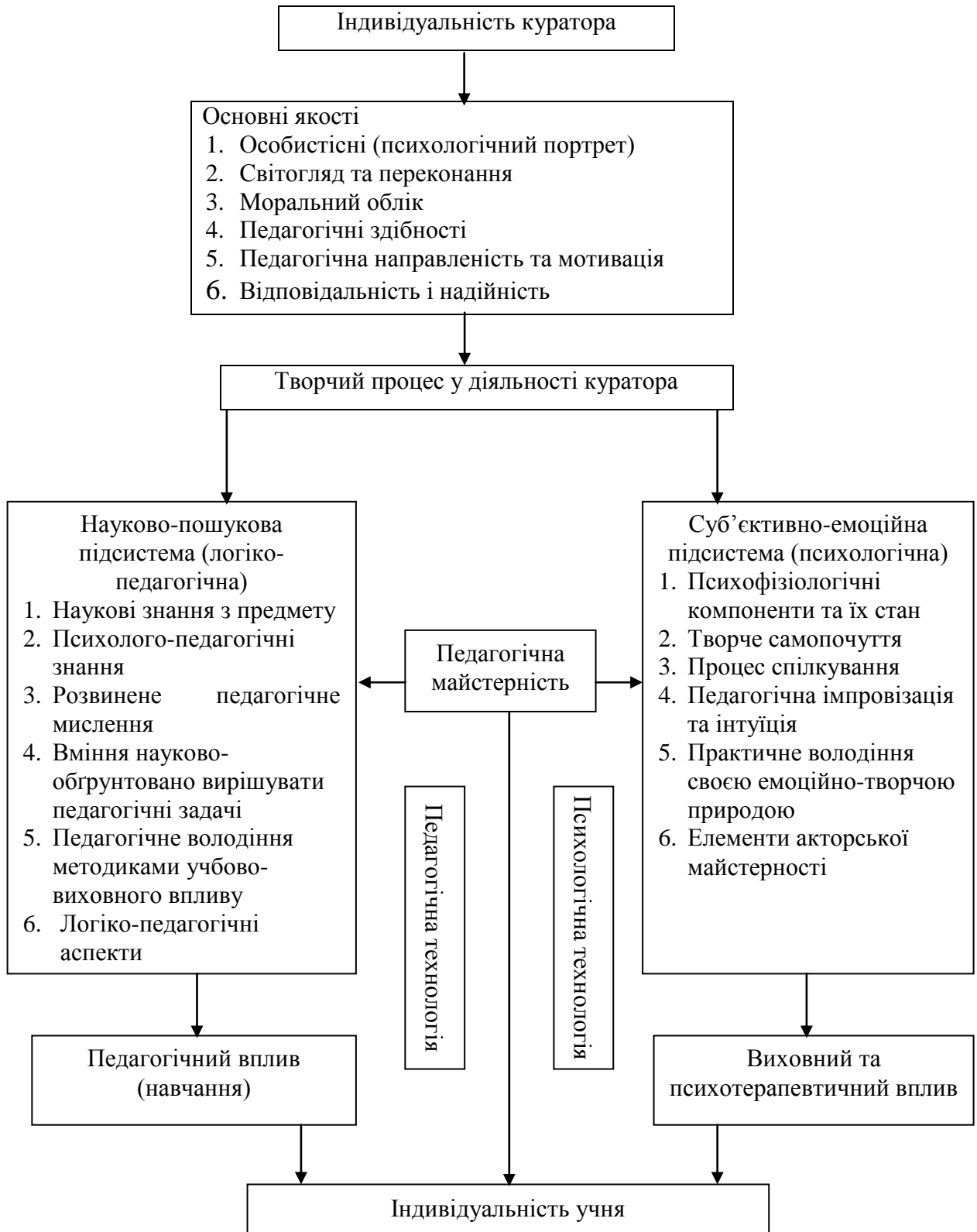
Рисунок 2.А. – Психологічна модель творчого процесу в діяльності куратора.