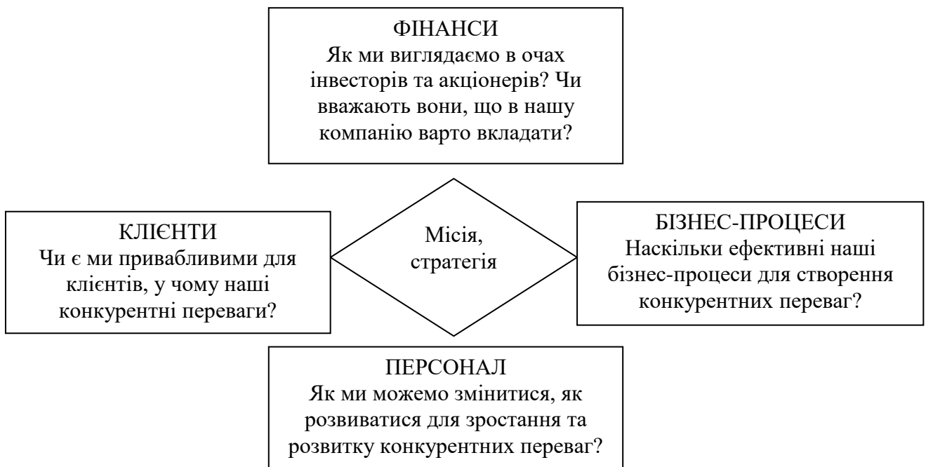
Рисунок 1.1 – Система ключових показників ефективності підприємства [34; 37].

Як бачимо з рис. 1.1, в системі ключових показників ефективності виділяють чотири основні їх групи: фінансові показники, показники активності клієнтів, показники ефективності бізнес-процесів, показники ефективності управління персоналом (формування, використання, освіта та розвиток людських ресурсів підприємства).