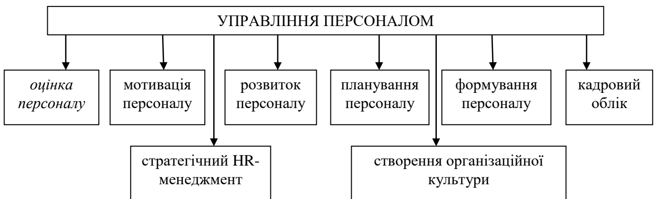
Рисунок 1.2 – Місце оцінки персоналу в системі управління персоналом підприємств [32]

Зазначене пов'язано з тим фактом, що оцінка ефективності діяльності персоналу являє собою інструмент аналізу кількісних та якісних характеристик персоналу потенціалу підприємства, його сильних і слабких сторін, а також засіб підвищення індивідуальних трудових здібностей працівника й зростання його кваліфікаційного рівня.