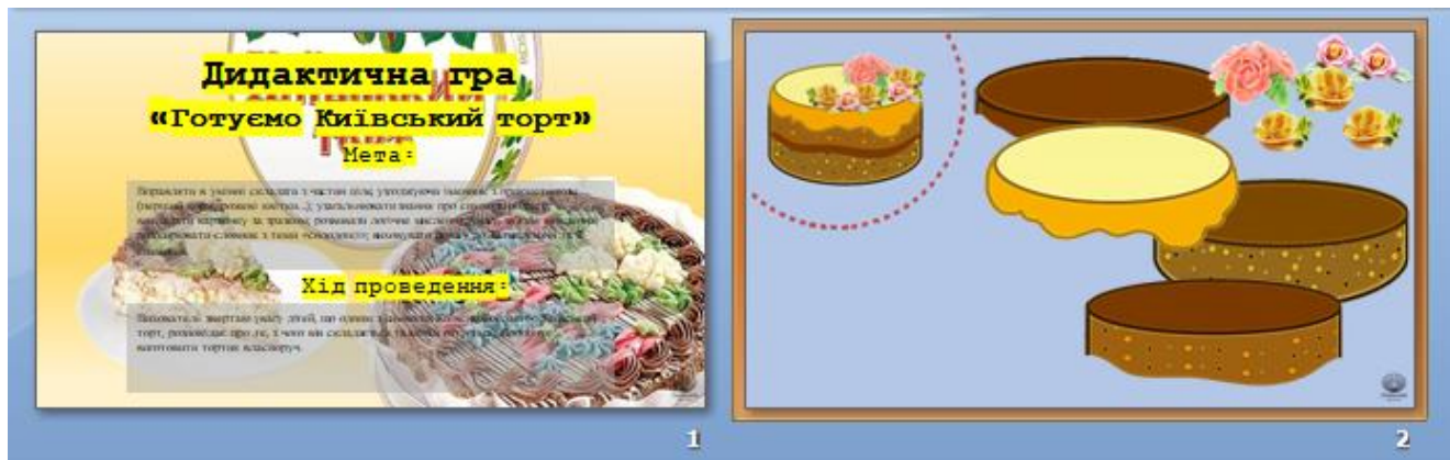
1. Київська область Гра «Готуємо Київський торт»