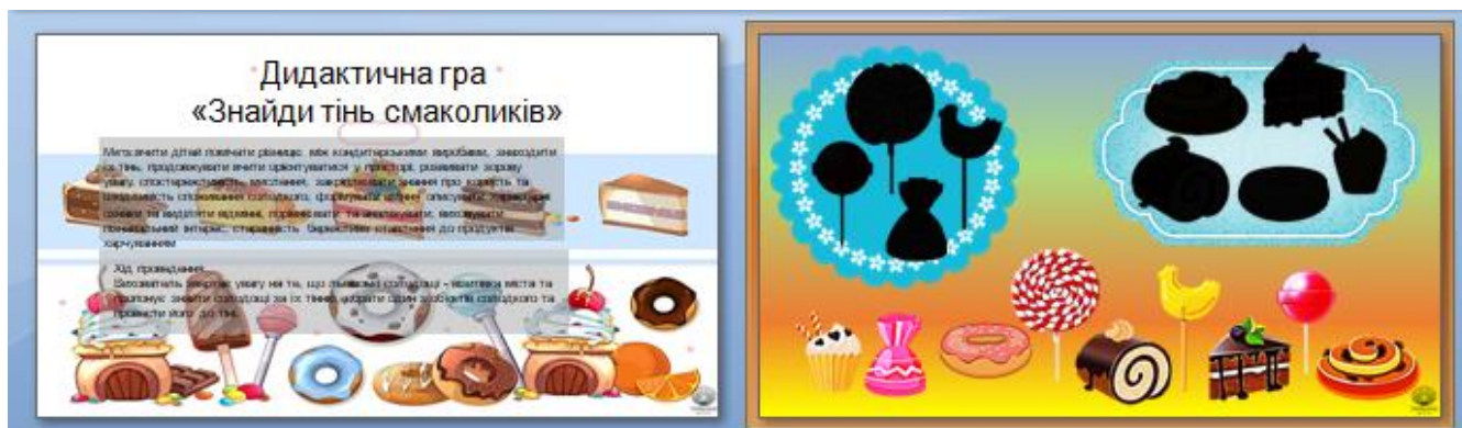
3. Львівська область Гра «Львівські солодощі»