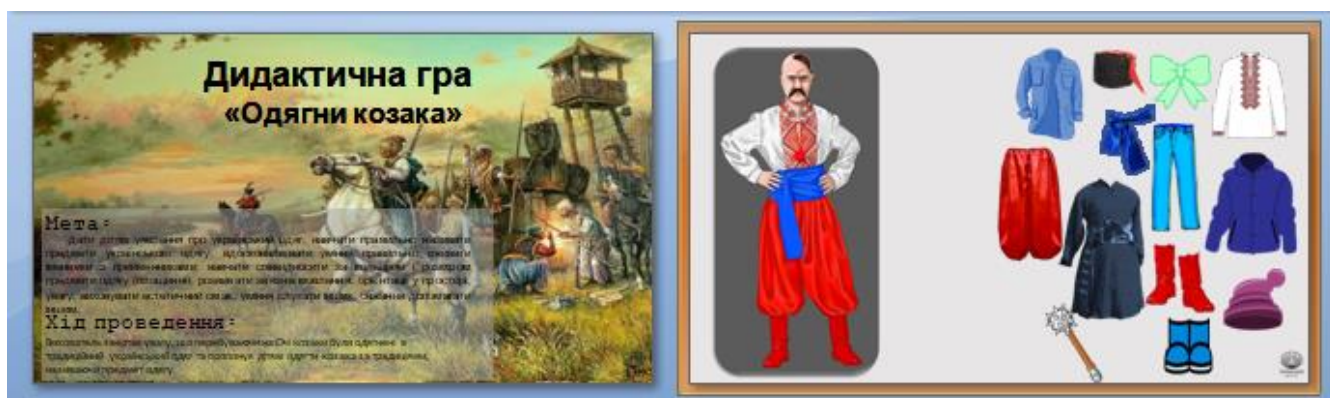
2. Запорізька область Гра «Одягни козачат на Січі»