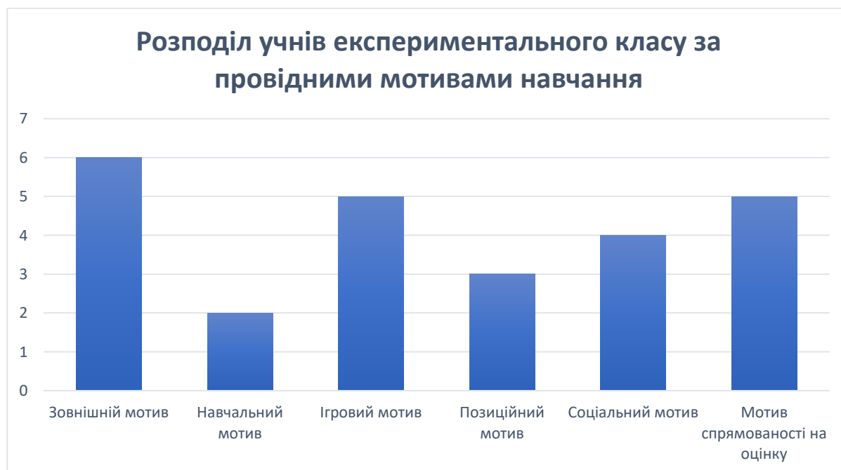
Рисунок 2.2. Розподіл учнів експериментального класу за провідними мотивами навчання (за методикою М. Гінзбург)

Отримані дані з таблиці подано нижче в діаграмах (рис. 2.2 та рис.2.3).