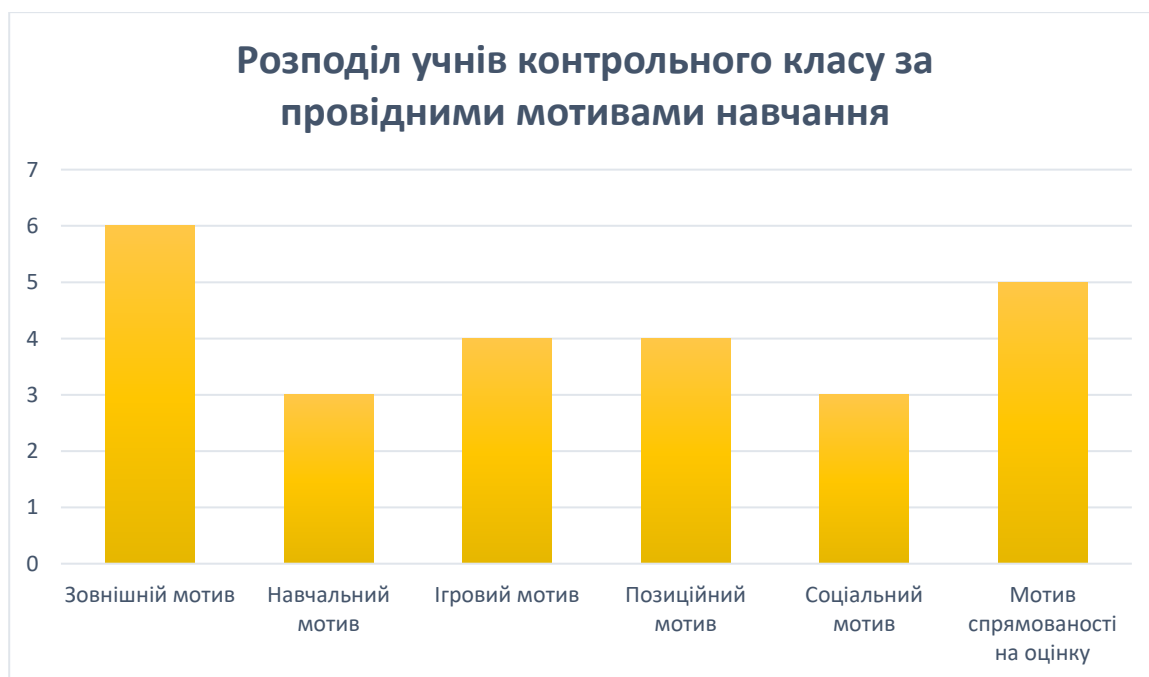
Рисунок 2.2 Розподіл учнів контрольного класу за провідними мотивами навчання (за методикою М. Гінзбург)

Аналіз таблиці 2.2 показує, що в учнів експериментального та контрольного класів переважає зовнішня мотивація (по 6 учнів – по 24%). Останнє місце в експериментальному класі посідає навчальний мотив (2 учні – 8%), в контрольному класі на останньому місці знаходяться навчальний та соціальний мотиви – по 3 учня (12%). У експериментальному класі соціальний мотив переважає у 4 учнів (16%). Однакова кількість учнів в експериментальній та контрольній групі мають мотив спрямованості на оцінку – по 5 учнів (по 20%). В експериментальному класі ігровий мотив має 5 учнів (20%), а позиційний – 3 учні (12%); у контрольному класі ігровий та позиційний мотив мають по 4 учні (по 16%).