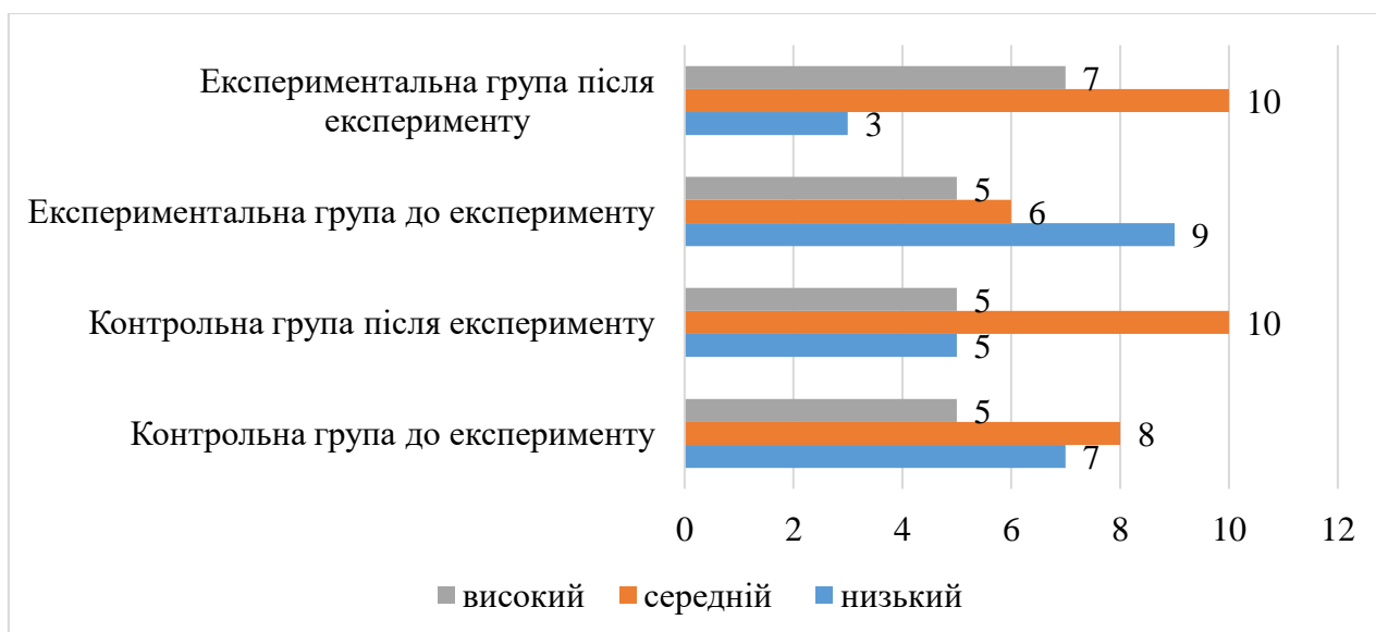
Рисунок 3.1. Результати дослідження соціальної компетентності за методикою «Продовж розповідь» (Е. Смірної) до і після експерименту

Для наочності проілюструємо дані на рисунку 3.1.