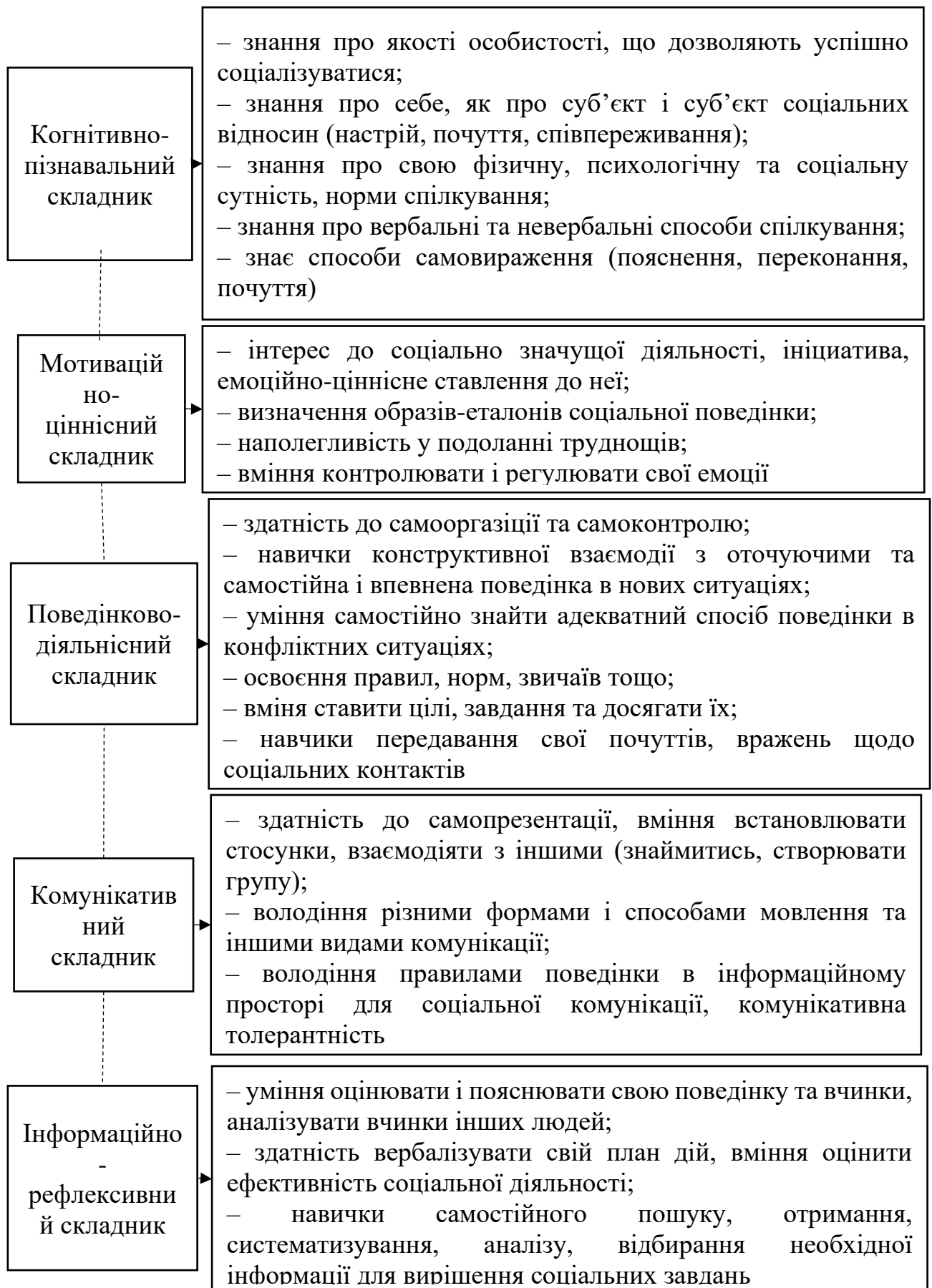
Рисунок 1.1. Складники та показники соціальної компетентності молодших школярів [12, с. 21]