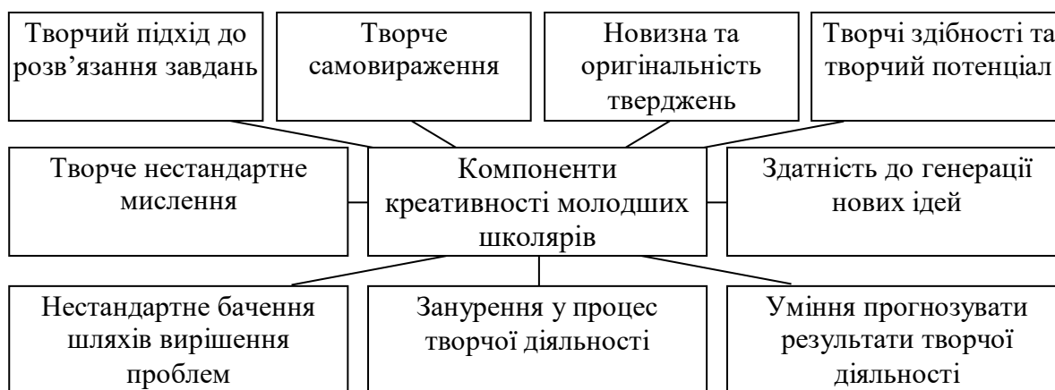
Рисунок 1.1. Компоненти креативності молодших школярів

Проаналізувавши теоретичні джерела та окремі положення наукової дискусії навколо педагогічної проблеми розвитку креативності молодших школярів, можемо виокремити її компоненти (рис. 1.1).