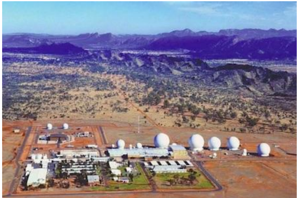
Розвідувальна станція «Пайн Геп» [54]