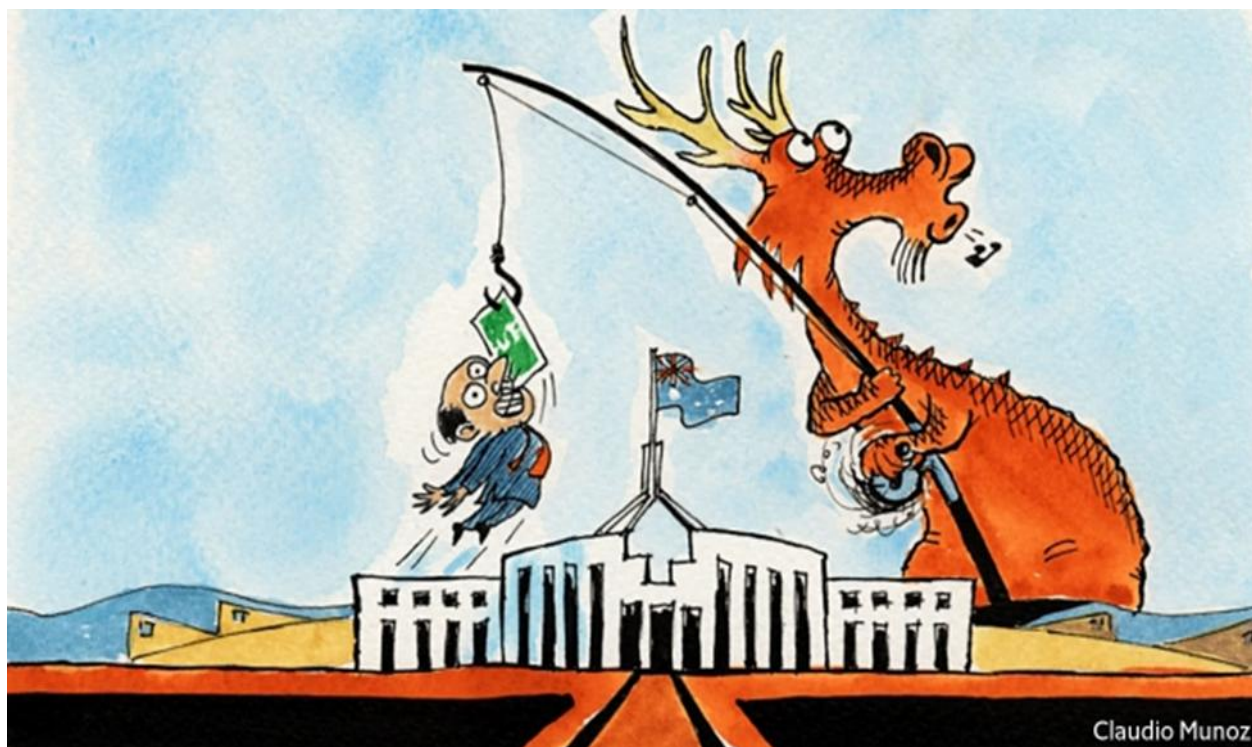
Карикатура Клаудіо Муноза з видання «The Economist» [7]