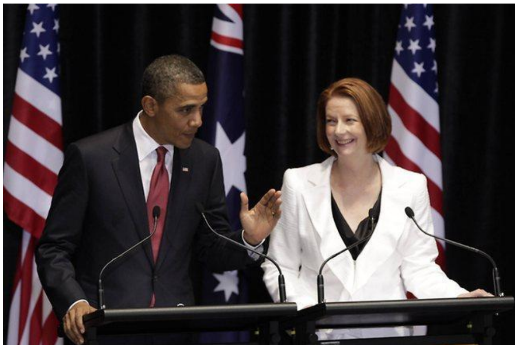
Візит президента Б. Обами до Канберри, 2011 р. Спільна медіа-конференція Б. Обами та Дж. Гілард, будинок парламенту [55]