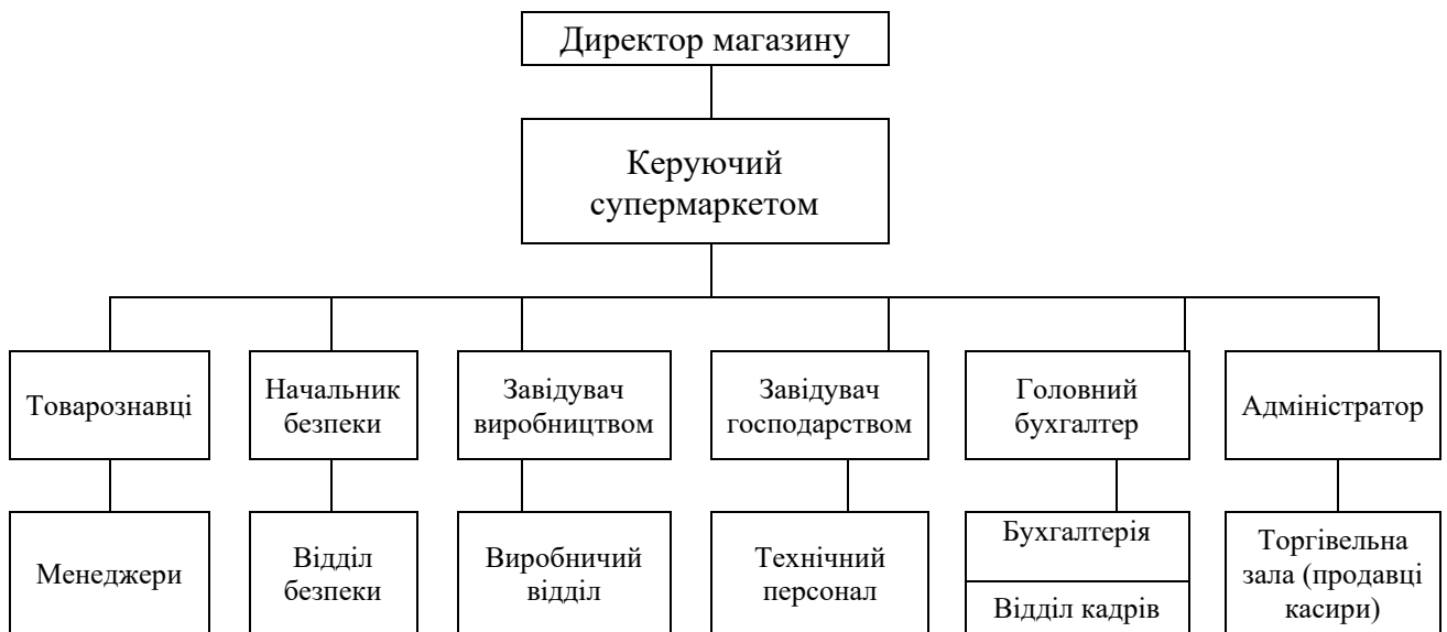
Рис. 2.2 – Організаційна структура супермаркету «Сільпо»

Організаційна структура магазину наведена нижче, на рис. 2.2.