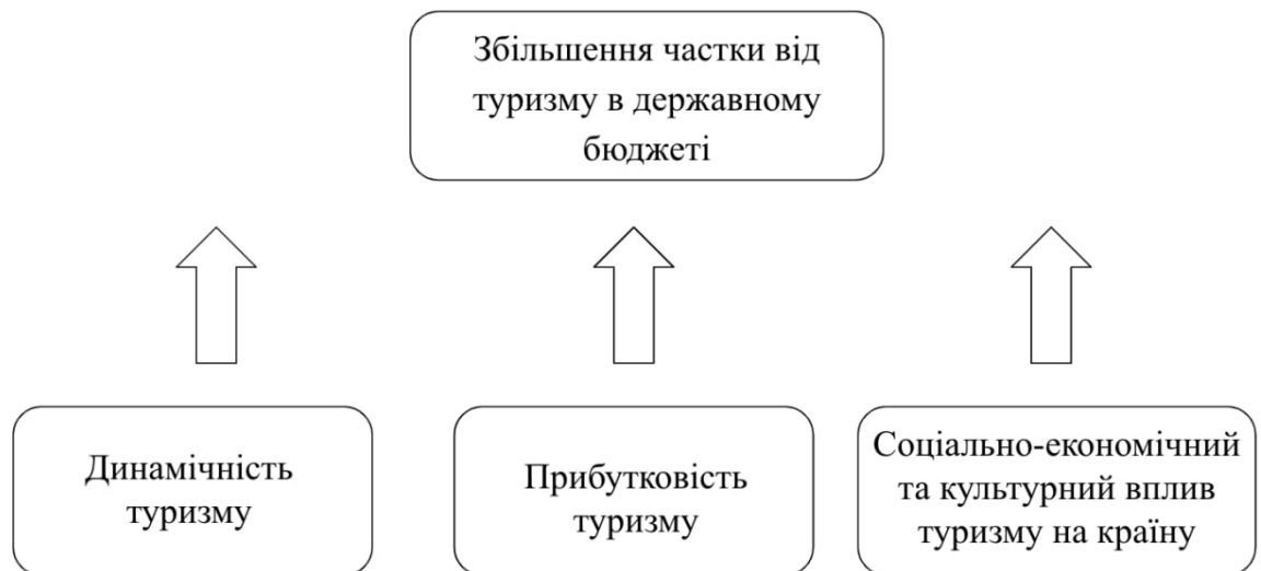
Рисунок 2.1 – Фактори, що впливають на збільшення частки від туризму в державному бюджеті

активно зростає і частка надходжень в національну скарбничку. На це впливає кілька факторів (рис 2.1)[5].