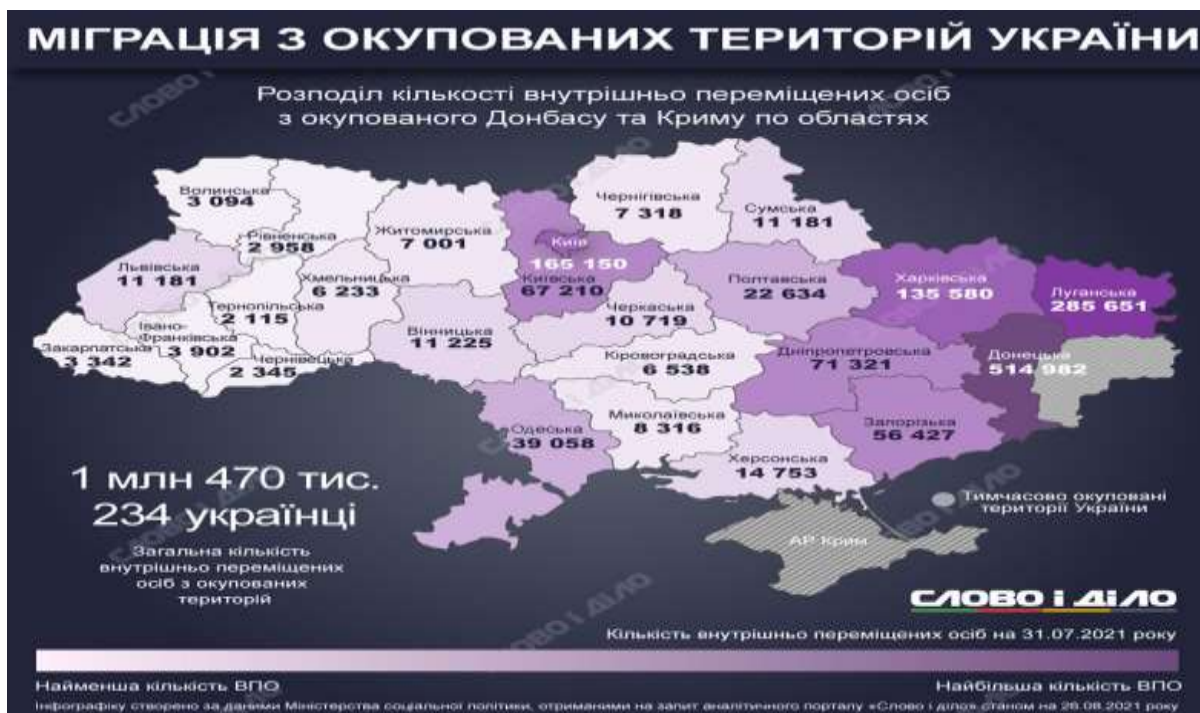
Рисунок А. 2 – міграція з окупованих територій України у 2021 році.