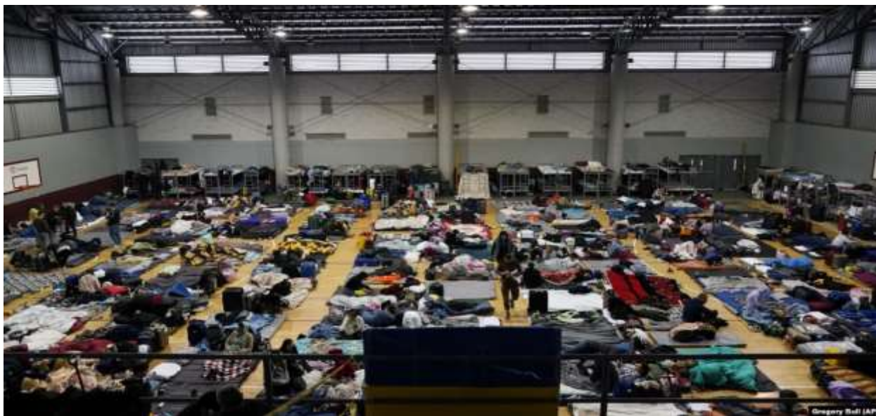
Рисунок А. 3 – Архівне фото: Біженці з України в спортзалі в Тіхуані, Мексика, 5 квітня 2022 року.