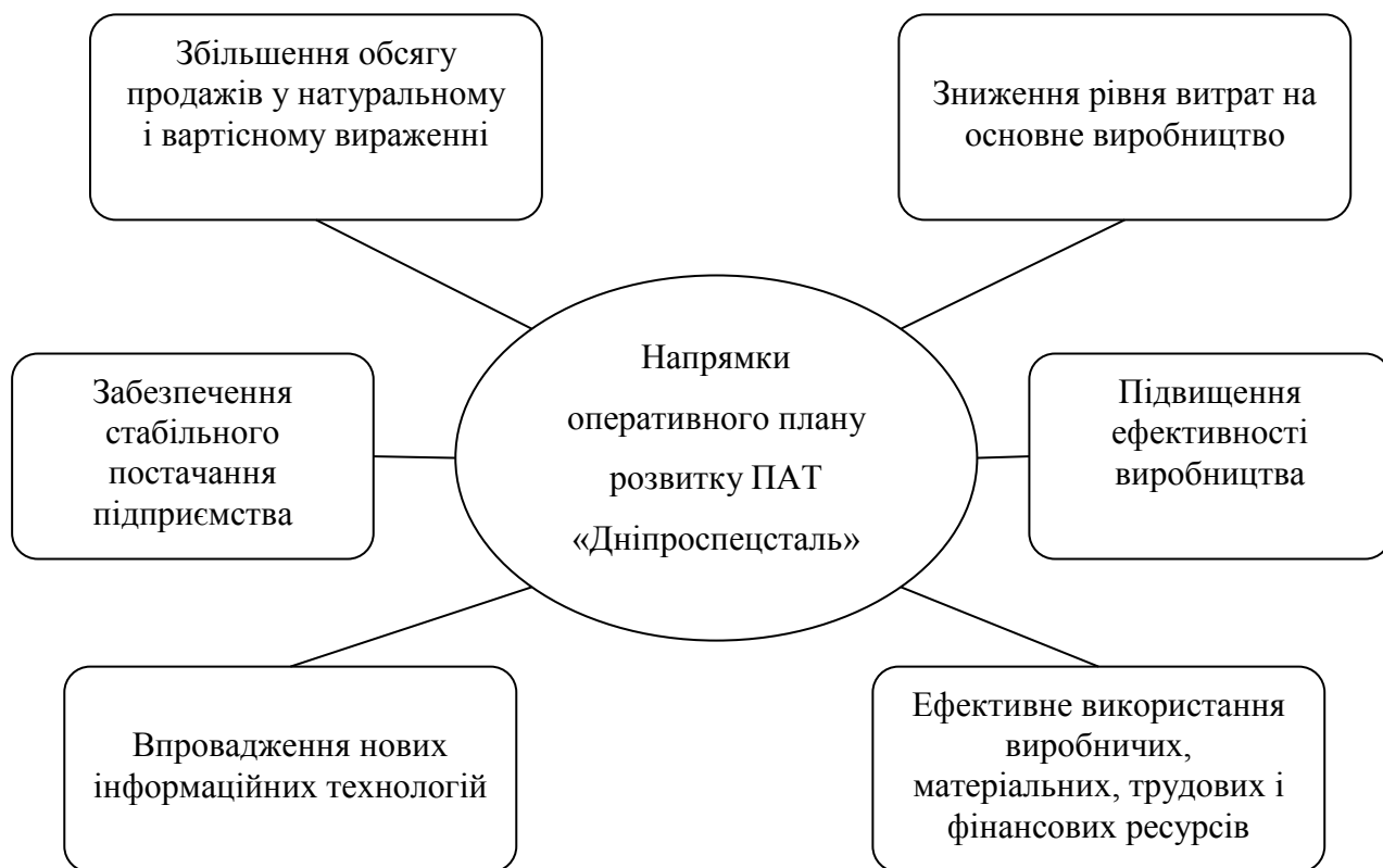
Рисунок 3 – Напрямки оперативного плану розвитку ПАТ «Дніпроспецсталь»

Згідно з загальними напрямками стратегічного плану розвитку ПАТ «Дніпроспецсталь» для ефективнішої діяльності підприємства запропоновано такі напрямки оперативного плану розвитку (рисунок 3).