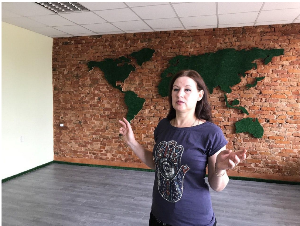
Рис.В.3. Групове заняття на тему «Погляд в минуле. Досвід поколінь». Міні-лекція «Казки та легенди як провідники моральних істин».