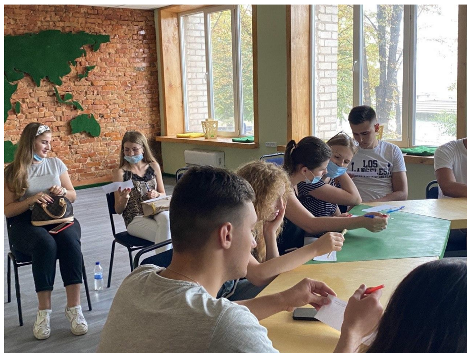
Рис.В.4. Групове заняття на тему «Погляд в минуле. Досвід поколінь». Створення групової казки.