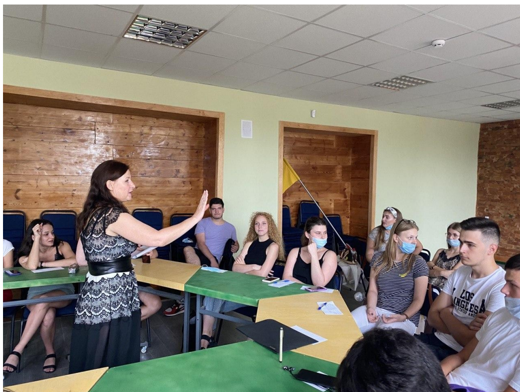
Рис.В.2. Перше заняття на тему «Релігійні цінності, як морально-етичні». Дискусія «Порада другу».