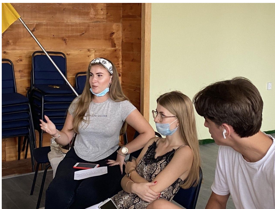
Рис. В.6. Заклучна бесіда. Зворотній зв'язок.