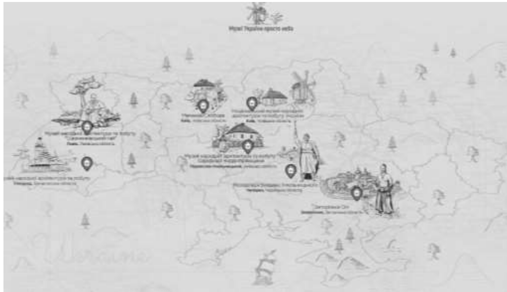
Рис. 2.2. Віртуальний тур українськими музеями просто неба

створення художнього контексту) та форми (аудиторні та позанавчальні) у структурі технологічного забезпечення формування художньо-естетичної культури майбутніх педагогів. Змістово-технологічне забезпечення формування художньо-естетичної культури майбутніх педагогів визначається як сукупність змістовного змісту цього процесу (змістовні напрями та їх складові) та його технологічна реалізація, що забезпечує оптимізацію процесу формування художньої творчості і естетичної культури студентів.