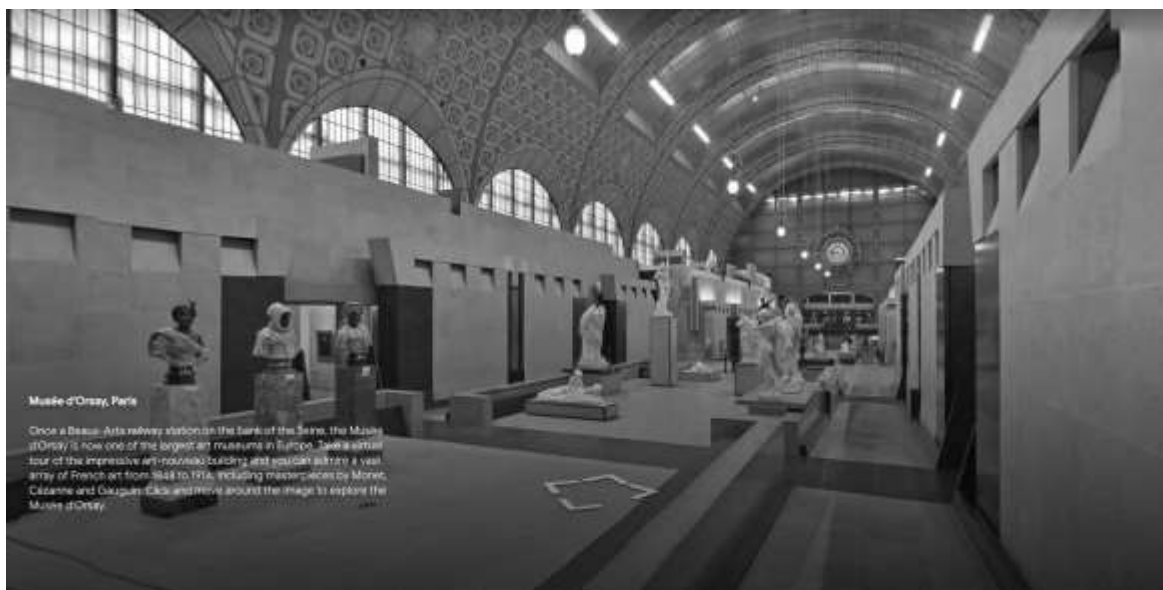
Рис. 2.1. Онлайн-екскурсія в інтернет-платформі «Google Arts & Culture»

Arts & Culture» (рис. 2.1) [90]. Це інтернет-платформа, що надає доступ до зображень творів мистецтва у високій якості.