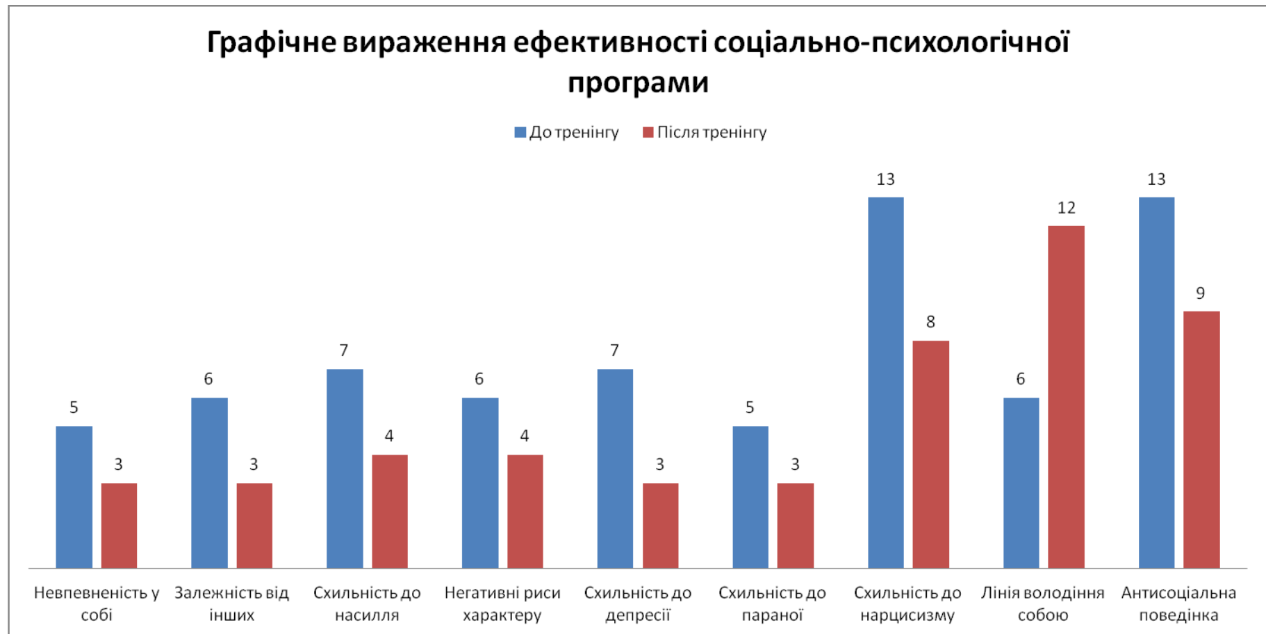
Рис. Ж.1 Гістограма результатів експерименту