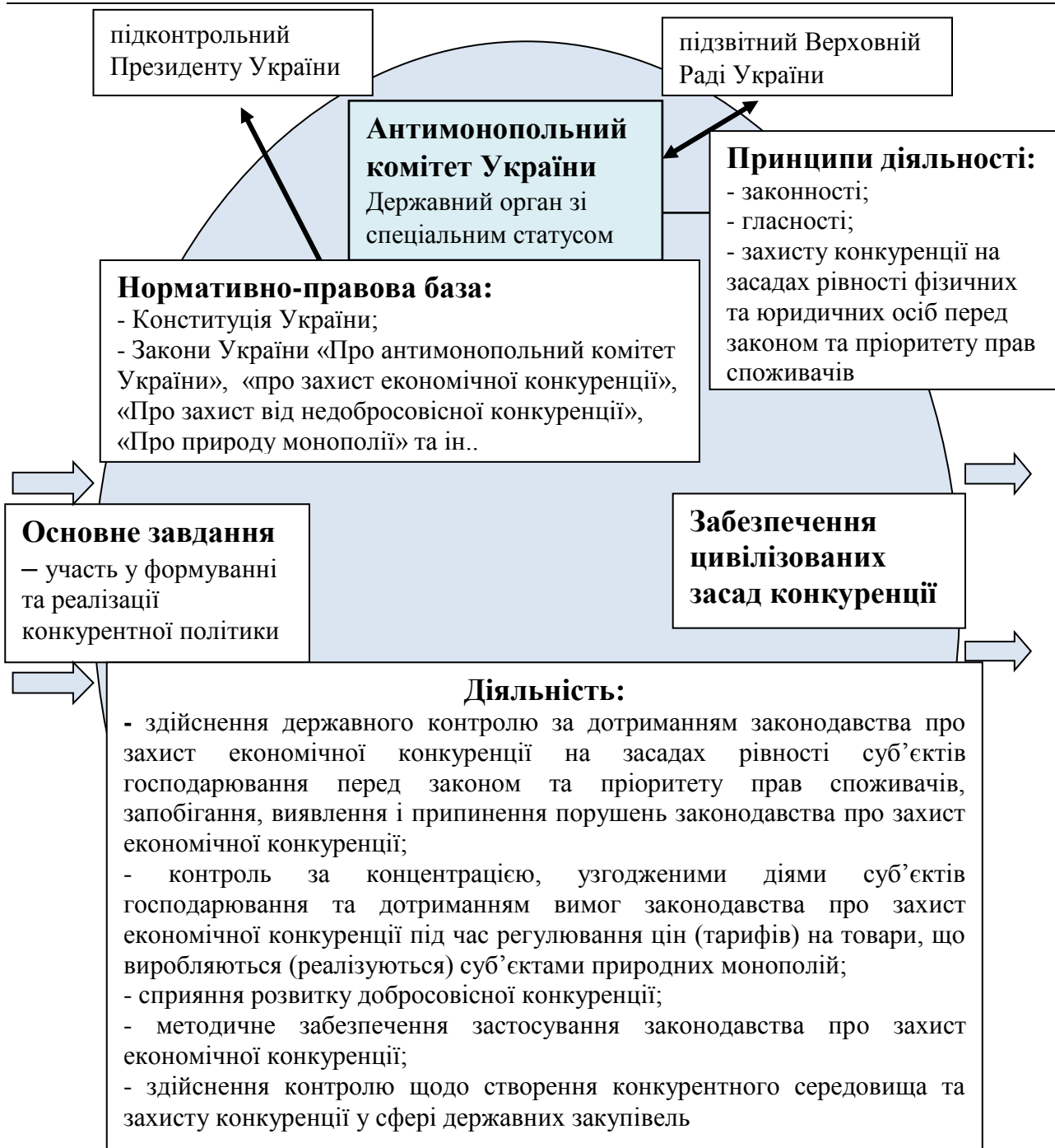
Рис. 1 Забезпечення державного захисту конкуренції антимонопольною діяльністю

Основним завданням Антимонопольного комітету України є участь у формуванні та реалізації конкурентної політики в частині [7]: