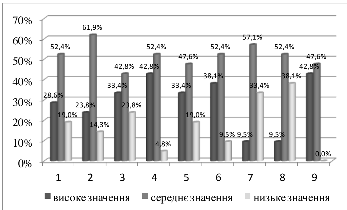
Рис. 2.1. Результати за методикою самовідношення С. Пантелєєва у контрольній групі