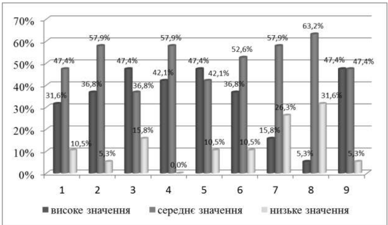
Рис. 2.4. Результати за методикою самовідношення С. Пантелєва у експериментальній групі (другий етап експерименту)

Як видно з рисунка 2.4. в експериментальній групі: